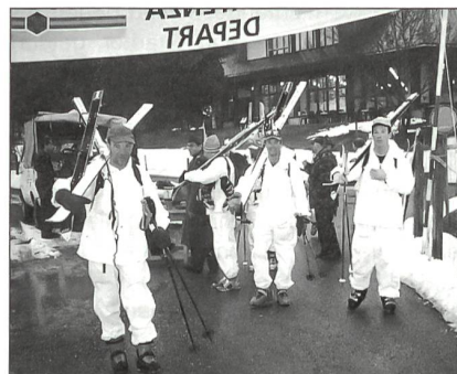
Auch das gehört zum Zweitägeler: Skier geschultert!

Um an diesem ausserdienstlichen Anlass bestehen zu können, braucht es aber etwas mehr als nur ein gutes Repertoire an Sprüchen. Notwendig sind viel körperlicher Einsatz, skifahrerisches Basiskönnen, Durchhaltevermögen und abgehärtet gegenüber winterlichen Witterungseinflüssen. Die üblichen Arbeitsinstrumente: Die Ausrüstung ist unsexy. Es braucht «normale» Tourenskier, Felle als Steighilfen, eine entsprechende Bindung – auch Modell Fritschi, Frutigen, ist ausreichend – gute Skistöcke, der weisse Armeeschneeanzug wird gratis zur Verfügung gestellt. Individuelle Gegenstände wie Mütze,