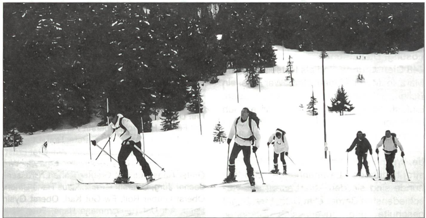
Im Schlittschuhschritt zum nächsten Kaffee crème.