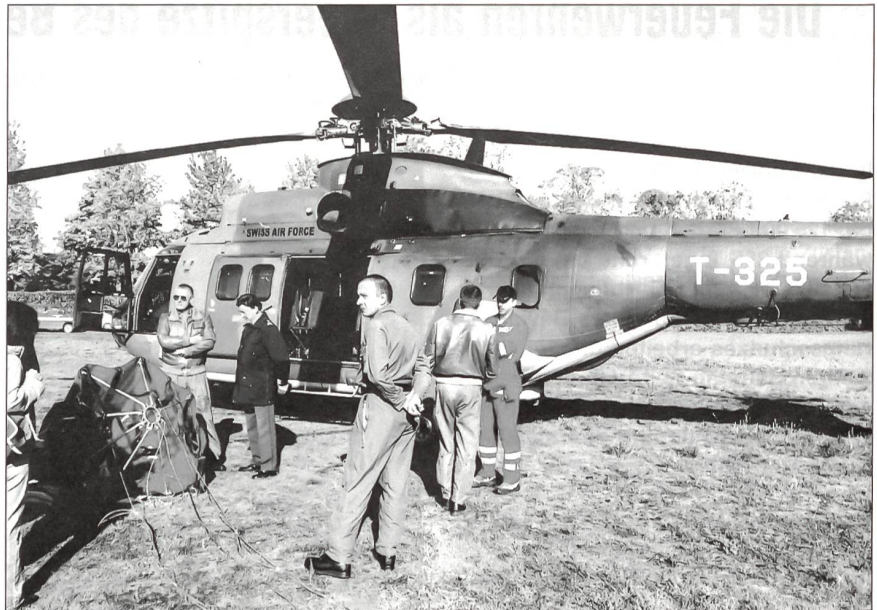
Super Puma der Armee zur Waldbrandbekämpfung.

Den als Milizformationen organisierten Gemeindefeuerwehren obliegt in erster Linie der Brandschutz in der eigenen Gemeinde. Bei grösseren Ereignissen oder bei Aufgaben, die mit den eigenen Mitteln nicht bewältigt werden können, greifen die Ortsfeuerwehren auf die Hilfe von Nachbargemeinden oder auf grössere Ortsfeuerwehren mit Stützpunktfunktion zurück. Diese verfügen in der Regel neben den üblichen Tanklöschfahrzeugen auch über einen spezialisierten Fahrzeugpark mit Autodrehleitern, Pionierfahrzeugen für technische Hilfeleistungen und allenfalls Chemie- und Ölwehrfahrzeuge. Industriebetriebe und andere Grossunternehmen in der Schweiz unterhalten