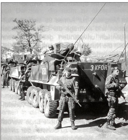
Die Swisscoy leistet wertvolle Dienste bei der Friedenssicherung in Kosovo.

Die Aufträge der Einsatzbrigaden können stark variieren: Vom Einsatz des Einzelmannes bis zum Einsatz des ganzen Verbandes, vom Hilfe- und Schutzauftrag in Friedenszeiten bis zum klassischen Kampfauftrag im Krisenfall – immer zu