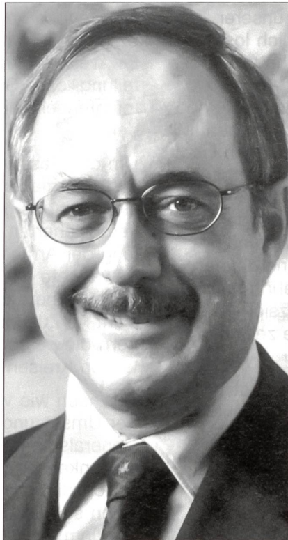
Bundesrat Samuel Schmid, Chef des Eidgenössischen Departementes für Verteidigung, Bevölkerungsschutz und Sport.

Der Bericht äussert sich auch zu den Problemen in den Lehrverbänden, dies nachdem unter dem Spardruck der Aufwuchs beim militärischen Berufspersonal gestoppt werden musste und für die Grundausbildung auf Milizkader der A 95 im WK-Rhythmus zurückgegriffen werden musste.