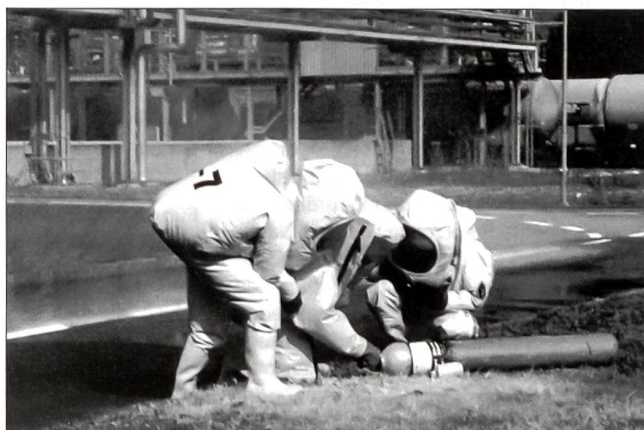
Zur Abdeckung des breiten Aufgabenspektrums benötigen die Feuerwehren zunehmend hochspezialisierte Fahrzeuge und vielfältiges Material.