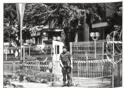
Armeeauftrag «Existenzsicherung» – Soldaten bei subsidiären Einsätzen.