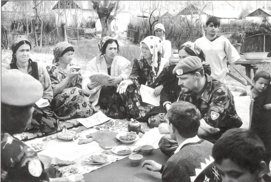
Persönliche Kontakte zur Bevölkerung beim Einsatz im Ausland.

Verbände des Heeres ihren Dienst zu Gunsten ziviler Behörden leisten. Hauptsächlich stellen die Einsatzbrigaden in direkter und meist eigener Verantwortung die Ausbildung der ihnen unterstellten Verbände im Bereich der Kernkompetenz «Raumsicherung und Verteidigung» sicher. Jede Formation wird entsprechend ihrer Herkunft, Waffengattung und spezifischen Aufgaben im Hinblick auf den klassischen Konflikt geschult. Dadurch wird das soldatische Handwerk eines jeden Einzelnen im Alleingang und im Verband minimal erhalten. Im Bedarfsfall, wie zum Beispiel bei einem Umschulungs- oder Einführungskurs, werden die Einsatzbrigaden durch die entsprechenden Lehrverbände unterstützt.