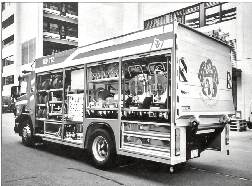
Ausbildung und Ausrüstung ergänzen sich und machen die Feuerwehren nicht nur bei Brandfällen zu einem unverzichtbaren Ersteinsatzelement.

Die Feuerwehren sind im Gesamtkonzept Bevölkerungsschutz von zentraler Bedeutung, dies umso mehr, als die Bezeichnung Feuerwehr das Aufgabengebiet dieser wichtigen Organisation nur noch unzulänglich umschreibt.