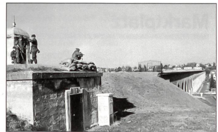
Sicherung einer Brücke im Kampf gegen Terroranschläge.

Das österreichische Verteidigungsministerium hat der Universität Innsbruck eine beachtliche Geldsumme für eine Professur gestiftet. 170 000 Euro jährlich sollen es ermöglichen, dass ab dem Herbst d.J. fünf Jahre hindurch ein Professor und ein Assistent im Rahmen des Studiums der Politikwissenschaft «europäische Sicherheitspolitik» unterrichten. Es sei wichtig, die Sicherheitspolitik auf ein höheres gesellschaftliches Niveau zu stellen, begründete Verteidigungsminister Günther Platter diese Zusammenarbeit.