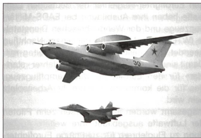
Frühwarn- und Leitflugzeug A-50 (Mainstay).

Das schwere Frachtflugzeug Ilyuschin Il-76 ist von der damaligen UdSSR in langwierigen Entwicklungsarbeiten zum militärischen Transporter, zum Tankerflugzeug und zum elektronischen