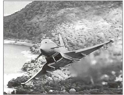
Eurofighter, das modernste Flugzeug der deutschen Luftwaffe.

Die Luftwaffe umfasst künftig drei statt vier Luftwaffendivisionen. Geplant sind vier Einsatzverbände und ein Ausbildungsverband mit dem neuen «Eurofighter», drei Flugabwehrraketengeschwader und drei Lufttransportverbände.