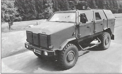
Geschützte Fahrzeuge wie der «Dingo 2» werden gekauft.

60 Transportflugzeuge vom Typ A 400 M, 152 Transporthubschrauber der Typen NH 90 und MH 90 sowie Verbesserungen der derzeit eingesetzten Transporthubschrauber CH 53 schaffen.