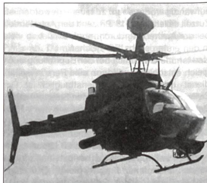
OH-58D Kiowa Warrior

Das 39-Mia.-Dollar-Projekt eines künftigen leichten Stealth-Mehrzweckhubschraubers RAH-66