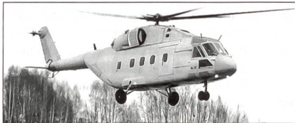
Mi-38 beim Erstflug am 22.12.03

Als möglicher Nachfolger der Typen Mil Mi-8 und Mi-17 Hip wurde seit 1983 der russische Mehrzweckhubschrauber Euromil Mi-38 entwickelt. Vorerst sind Triebwerke von Pratt & Whitney Canada eingebaut.