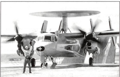
Hawkeye der Aéronavale

Northrop Grumman lieferte das dritte Führungs- und Kontrollflugzeug E-2C Hawkeye an die französische Flotte. Diese hochkomplexen AWACS sind Bestandteil der Ausrüstung des Flugzeugträgers «Charles de Gaulle».