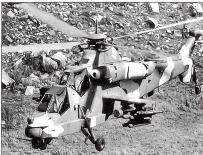
Südafrikanische AH-2A Rooivalk

Die südafrikanischen Streitkräfte erhalten in den nächsten drei Jahren eine unbekannte Anzahl von Kampfhubschraubern des Typs Denel AH-2A Rooivalk.