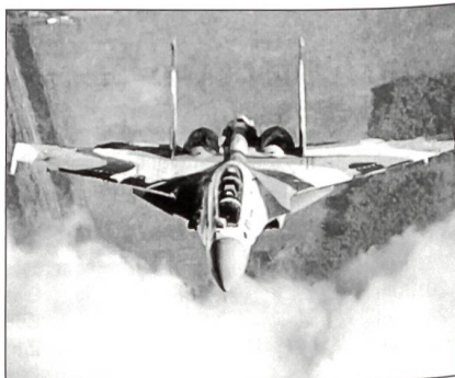
Russischer SU-30 Flanker

Die Vietnamese People's Army Air Force will gebrauchte Jagdbomber des Typs Suchoi SU-22 Fitter beschaffen. Mögliche Lieferländer sind Russland, die Ukraine, die Tschechei und Polen. Diese Kampfflugzeuge würden den gegenwärtigen Bestand von 53 SU-17/-20/-22 ergänzen.