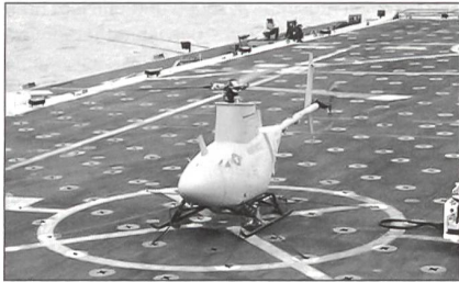
UAV-«Fire Scout» der US Navy.

In der zukünftigen taktischen Aufklärungs-, Beobachtungs-, Nachrichtengewinnungs- und Zielsuche-Architektur des US-Heeres wird «Fire Scout» ein Schlüsselement sein. Es wird eine Bildaufklärung, Datensammlung und -verbreitung in Echtzeit auf der Brigadeebene ermöglichen.