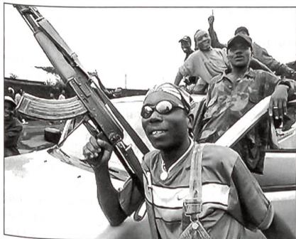
Aufständische in Liberia.

Die 53 Staaten der Afrikanischen Union (African Union) planen, mehr für ihre Sicherheit zu tun. Eines der wichtigsten Projekte unter zahlreichen anderen sieht die Afrikanische Union in der Schaffung einer gemeinsamen Verteidigungs- und Sicherheitspolitik. Auch eine gemeinsame Streitkraft für den Einsatz in afrikanischen Krisenregionen soll gebildet werden. Weil man in den USA Sorge hat, dass sich Al Kaida-Unterstützer oder ähnliche radikale Elemente in Gebiete zurückziehen, die ausserhalb der Kontrolle der staatlichen Regierungsmacht liegen, will man in Washington diese Idee unterstützen und versuchen, den afrikanischen Staaten bei der Stärkung ihrer Sicherheit zu helfen. Der Beistand zielt primär darauf ab, die Qualität und die Professionalität der afrikanischen Streitkräfte zu verbessern. Denn ohne diese Eigenschaften wäre jede andere Hilfe, wie Technik, sinnlos. Man ist in Washington auch überzeugt davon, dass Waffenlieferungen der falsche Weg