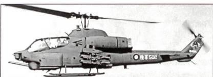
Taiwanische AH-1W Cobra

Taiwanische Firmen und Bell Helicopter Textron modernisieren alle 62 Kampfhubschrauber des Typs Bell AH-1W Cobra. Überdies sollen weitere 30-45 Kampfhelikopter beschafft werden. Um diesen Auftrag bewerben sich gegenwärtig die Firmen Bell mit der AH-1Z und Boeing mit der AH-64D Apache Longbow.