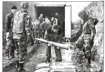
SFOR-Soldaten helfen die zahlreichen Überbestände an Munition zu beseitigen.

Die Europäische Union wird das Kommando über die Stabilisation Force (SFOR)-Truppen in Bosnien-Herzegowina übernehmen. Dieses Vorgehen ist zur Entlastung der NATO und zur Stärkung der strategisch-operativen Fähigkeit im militärischen Bereich der EU beabsichtigt. Es ist auch offensichtlich, dass sich die USA mit ihren Kräften aus der SFOR verabschieden und diesen Krisenbereich der EU überlassen wollen. Der Plan für diesen Kommandowechsel war schon längere Zeit bekannt und sollte gegen Ende des Jahres 2004 realisiert werden. Wie aus diplomatischen Kreisen zu vernehmen ist, soll