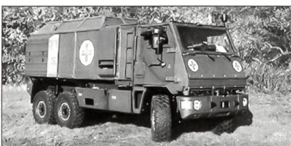
«DURO 3» – ein gepanzertes 6x6-Radfahrzeug für die Sanität.

Mitte April wurden die ersten gepanzerten «DURO 3» für den Zentralen Sanitätsdienst der Bundeswehr übergeben. Es waren die ersten von der Firma Rheinmetall Landsysteme GmbH gebauten Fahrzeuge der Variante «Beweglicher Arzttrupp» (BAT). Mit der Einführung des «DURO 3» ist der Einstieg in den Schutz für die unterstützenden und versorgenden Truppenteile möglich. Das hochmoderne Mehrzweckfahrzeug kann dank modularer Bauweise innerhalb kürzester Zeit diverse Konfigurationen für die unterschiedlichsten Missionen annehmen. Zudem ist der «DURO 3» mit seinen nur 12 Tonnen Gewicht problemlos über Lufttransport verlegbar. «DURO 3» wurde in einer exklusiven Kooperationsvereinbarung mit der Schweizer Firma MOWAG hergestellt und ist ein gepanzertes 6x6-Rad-Mehrzweck-Fahrzeug. Als solches wurde es mit einer Anzahl von Schutzsystemen