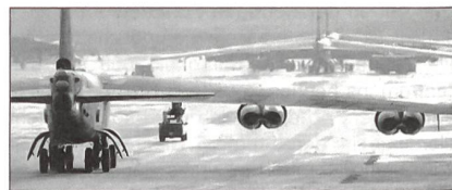
B-52H auf Anderson Air Force Base, Guam

Künftig sollen dauernd Rotations-Detachemente schwerer Langstreckenbomber der Typen Boeing B-52H Stratofortress, Rockwell B-1B Lancer oder Northrop B-2 Spirit auf der Pazifik-Insel Guam stationiert werden.