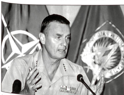
US-General James Jones, Befehlshaber von ACO.