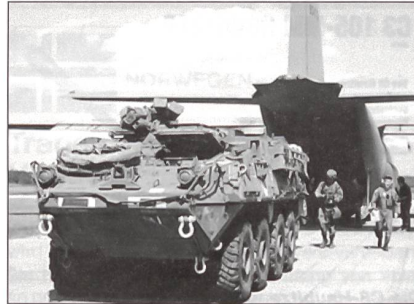
Für strategischen Lufttransport geeignet: «Stryker» der US Army.

Mit dem «Truppenversuch» beim Geschwader in Laage hat der offizielle Flugbetrieb der Deutschen Luftwaffe mit dem «Eurofighter» nun seinen Anfang genommen. Rene