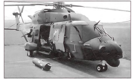
NH-90-Hubschrauber für die neuen Fregatten.

Mitte März d.J. gab die norwegische Regierung einen Langzeitplan für die weitere Anpassung und Modernisierung der Streitkräfte heraus.