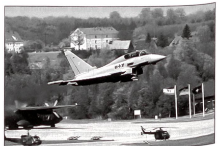
«Eurofighter» – ein Kampfflugzeug derzeit ohne Konkurrenz.

Im Jahr 1991 kam es zur Endmontage des ersten Prototyps. Wegen der drohenden Kostenexplosion erfolgten neue Beratungen. Die Verteidigungsminister der beteiligten Nationen gelangten im August 1992 zu einer Änderung des Entwicklungsprogramms: Das Flugzeug soll kostengünstiger und an die veränderten sicherheitspolitischen Rahmenbedingungen angepasst werden. Im darauf folgenden Dezember erfolgte der Beschluss zur Neuorientierung des