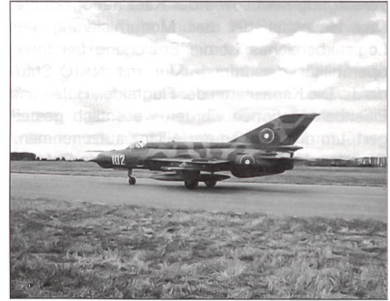
Alle Teilstreitkräfte werden modernisiert (im Bild MiG-21 der Luftstreitkräfte).

Die Streitkräfte-Reform begann in Sofia im Jahr 1997. Der «Plan 2004» sieht den Umbau der Streitkräfte bis Ende des heurigen Jahres vor. Als Friedensstärke sind 45 000, als Kriegsstärke 100 000 Soldaten für die Streitkräfte vorgesehen. Das Ziel der Reform ist dabei, Streitkräfte zu haben, die mit den finanziellen Möglichkeiten des Landes übereinstimmen. Es sollen wirkungsvolle, modulare, bewegliche und kampfbereite Streitkräfte sein, die in der Lage sind, das Land zu schützen, und die ein gleichwertiger