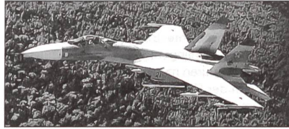
Auch die Luftstreitkräfte (im Bild Jäger J-11) sind mit Teilen atomar gerüstet.

versorgung sein sowie der Kauf neuer Schiffe. Das Hauptziel bei der Modernisierung des Logistikbereiches ist die Erreichung der Interoperabilität der Infrastruktur mit NATO-Standards. Die Kapazitäten der Flugfelder, Häfen und Eisenbahnstationen werden wesentlich gesteigert, um die Truppen der Allianz aufzunehmen. Ob tatsächlich alle Ziele der geplanten Reformschritte bis Ende dieses Jahres erreicht werden, dürfte zumindest fraglich bleiben. Rene