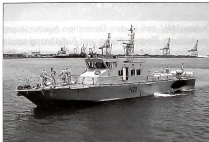
Eines der fünf Patrouillenboote der ICDF.

auf die Übernahme des «Land Component Command» (LCC) vor, das es ab 1. Juli d.J. innerhalb der NATO Response Force (NRF)-3-Struktur bis zum 15. Januar 2005 einnimmt.