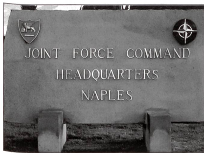
In Neapel vor dem neuen «Joint Force Command»-Hauptquartier.

Am 2. April fand mit einer feierlichen Zeremonie in Neapel die Inauguration des neuen NATO-Kommandos «Joint Force Command» (JFC) mit der Übernahme eines neuen Hauptquartiers und einer neuen Aufgabe statt. Gleichzeitig wurde die Auflösung von «Allied Forces Southern