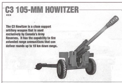
Die C3-Haubitze wird als «Mobil Gun System» verwendet.

Durch die Verlastung der C3 auf LKWs soll die Überlebensfähigkeit der Besatzung besser gewährleistet werden, weil durch deren Beweglichkeit eine Zielauffindung durch den Gegner