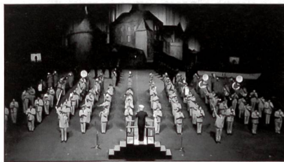
Die Homeguard (im Bild deren Band) wird zielorientierter organisiert und ausgebildet.

Die Schnellen Reaktionskräfte werden durch 6 bis 20 Tage Ausbildung in jedem Jahr für alle Aufgaben der Heimwehr ausgebildet. Die Verbände werden in einem relativ hohen Grad an Einsatzbereitschaft gehalten. Jeder Heimwehrbezirk wird eine kleine Anzahl von Personal – etwa 10 Prozent – in diesen Verbänden haben. Verstärkungskräfte sind Truppen, die jährlich an bis zu 3 und 5 Tagen ausgebildet werden, mit dem Zweck, die Schnellen Reaktionskräfte in einer kurzen Reaktionszeit verstärken zu können. Jeder Heimwehrbezirk wird etwa 50 Prozent in diesen Truppen stellen. Nachfolgekräfte werden 3 und 5 Tage jährliches Training haben. Sie haben Uniformen und Ausrüstung bei sich und werden zum Teil auch mit Material der Einheiten und Verbände ausgestattet. Diese Truppen werden hauptsächlich statische Aufgaben ausführen. Rene