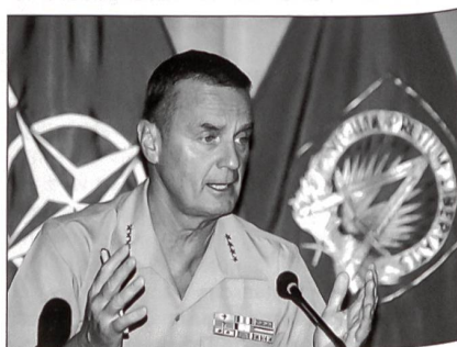
Nato-Saceur General Jones.

SACEUR sieht die NATO-Response Force (NRF) als jenes Instrument, mit der er ab Oktober 2006 in der Lage sein wird, auf eine breite Skala von Herausforderungen zu antworten. Sie soll durch bessere militärische Ausbildungs- und Übungsprogramme effektiver vorbereitet werden. Diese