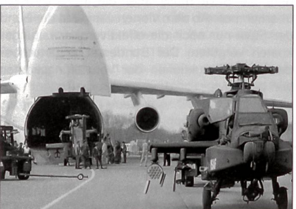
AN-124 / AH-64D

Das niederländische Heer verlegte im Rahmen des NATO-Engagements sechs Kampfhubschrauber AH-64D Apache nach Afghanistan. Unten stehendes Bild zeigt den Verlad dieser Helikopter in eine russische Chartermaschine des Typs Antonow AN-124 auf dem holländischen Luftstützpunkt Gilze-Rijen. Island, welches keine Truppen unterhält, bezahlte die Transportkosten in Höhe von 302 000 Dollar.