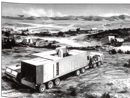
Das «Mobile Taktische Hochenergie-Lasersystem» (MTHEL).

Die Fähigkeit, rasch zu reagieren, verbunden mit einer Treffsicherheit, jenen Eigenschaften, die bereits bei MTHEL-Versuchen gezeigt werden,