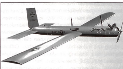
Mini-UAV «Silver Fox».

Vor kurzem kauften die kanadischen Streitkräfte das unbemannte Mini-Fluggerät (UAV)-System «Silver Fox», das von Advanced Ceramics Research aus Tucson, Arizona, hergestellt wird. Das unbemannte Luftfahrzeug in Miniausführung wurde nach einem anspruchsvollen Wettbewerb ausgewählt und gekauft. Bisher hatte man eine Anzahl verschiedener Modelle von unterschiedlichen Herstellern geleast. Mit Kosten von etwa