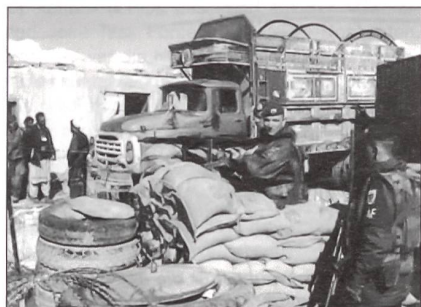
Kadersoldaten werden für Auslandseinsätze (im Bild österreichische ISAF-Soldaten 1992 in Afghanistan) rasch benötigt.

sollen das drei Infanteriekompanien (mit Mannschaftstransportpanzern – MTPz), eine Panzergrenadierkompanie (mit Schützenpanzern – SPz), eine Aufklärungskompanie und eine ABC-Abwehrkompanie sein.