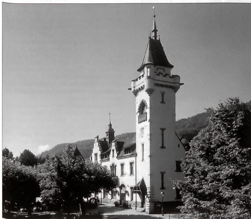
Ort der Delegiertenversammlung: Schützenhaus Albisgüetli in Zürich.