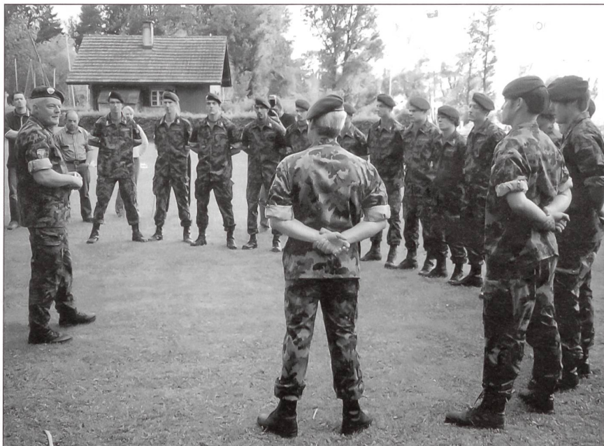
Divisionär Solenthaler dankt den neuen Sportsoldaten.

Wetter und etwas Bise hat der äussere Rahmen die sportpolitische Rolle dieses neuen Angebotes im Rahmen der Armee XXI sehr gut wiedergegeben. Das Konzept des Bundesrates für eine Sportpolitik in der Schweiz greift!