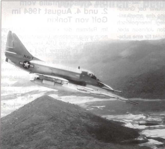
Die Ereignisse im Golf von Tonkin führten zum verstärkten Engagement der USA in Vietnam und letztlich zum Vietnamkrieg. Bereits ein Jahr später flogen US-Kampfflugzeuge systematisch Angriffe gegen Ziele in Nordvietnam, wie hier eine A-4E «Skyhawk» der Attack Squadron 23 vom Flugzeugträger «USS Oriskany».

wässer, Nachrichten zu beschaffen hatte. In den Tagen zuvor hatten südvietnamesische Schnellboote wiederholt Einrichtungen im Norden angegriffen und verdeckte Operationen geführt. Dies war offenbar der Anlass, am 2. August auch gegen die «USS Maddox» vorzugehen. Nicht völlig unvorbereitet wurde diese kurz nach 1600 südlich der Hon-Me-Insel von den drei Torpedoboote T-333, -336 und -339 des sowjetischen Typs P-4 angegriffen. Nach Warningschüssen eröffnete die «USS Maddox» das Feuer auf die Angreifer. Kurz danach griffen auch vier F-8E-«Crusader»-Abfangjäger des Flugzeugträgers «USS Ticonderoga» (CVA-14) ins Geschehen ein und griffen ihrerseits die PT-4 an. Angeführt wurden sie von Fregattenkapitän James Stockdale, Kommandant der Fighter Squadron 51. Nach 20 Minuten war das Gefecht vorbei, ein Boot versenkt, eines beschädigt.