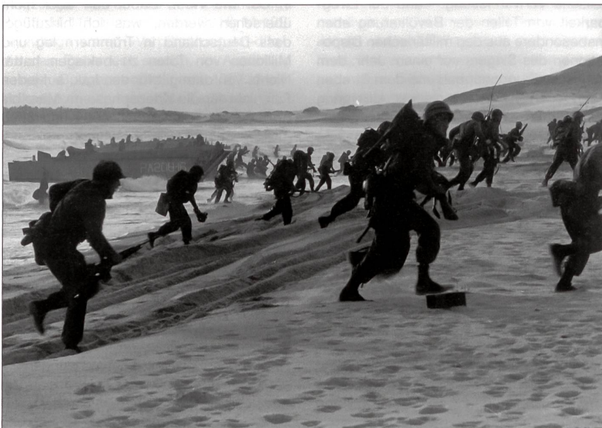
Im Februar 1965 genehmigte Präsident Johnson den Einsatz von US-Bodentruppen in Südvietnam. Kurz danach gingen die ersten Truppen, U.S. Marines, an Land. Die Aufnahme zeigt die Anlandung von US-Truppen bei Tam Quan 1965.

Die USA empfanden den Ausgang der Indochina-Konferenz als Rückschlag für die freie Welt. In der Folge arbeiteten sie auf ein regionales Bündnis der freien Staaten im Kampf gegen die Ausbreitung des Kommunismus hin. Dies führte im September 1954 zum Manila-Pakt, auch als Verteidigungsbündnis SEATO («South East Asia Treaty Organisation») bekannt. Und die USA begannen sukzessive, die Rolle der Franzosen zu übernehmen, nicht zuletzt deswegen, weil die Franzosen es versäumt hatten, ein kompetentes südvietnamesisches Offizierskorps aufzubauen. Ab März 1960 wurden im Rahmen des amerikanischen MAAG («Military Assistance Advisory Group») Militärberater und etwas später Special Forces («Green Berets») nach Südvietnam geschickt, um dort die Streitkräfte bis hinunter auf Bataillonstufe zu beraten. 1959 wurden die ersten zwei US-