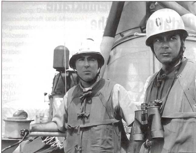
Der Kommandant der «USS Maddox», Fregattenkapitän Ogier (rechts), und der Kommandant des Zerstörerverbandes, Kapitän zur See Herrick, an Bord der «USS Maddox». Sie waren die unmittelbaren Betroffenen der Gefechte vom 2. und 4. August 1964 im Golf von Tonkin, die in der Folge zum verstärkten US-Engagement und zum Vietnamkrieg führen sollten.

Zurückschlagung bewaffneter Angriffe gegen die Streitkräfte der USA und zur Verhinderung weiterer Aggression» zu unternehmen. Dies sollte eine für den weiteren Konfliktverlauf in Vietnam äusserst folgenschwere Entscheidung werden.