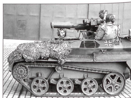
Wiesel (lufttransportierbares Mehrzweckfahrzeug)