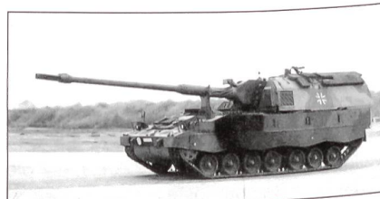
PzH 2000 (Selbstfahrgeschütz/Panzerhaubitze)