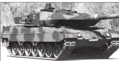
Leopard 2A5 (Kampfpanzer)