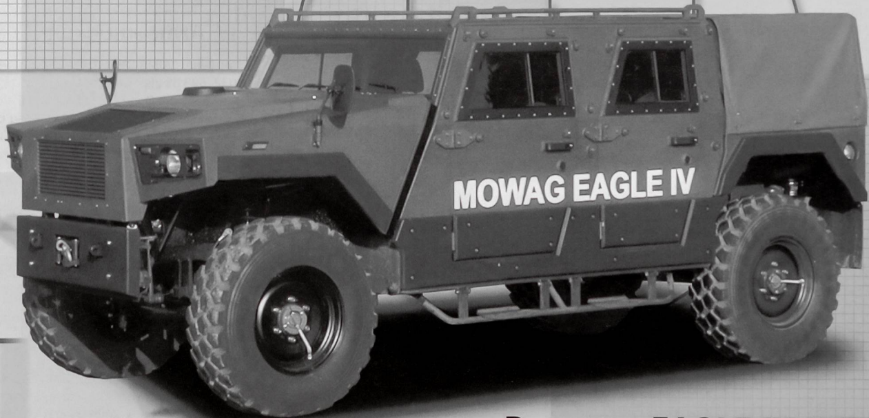
Der neue EAGLE IV 4x4

Die neu entwickelten MOWAG EAGLE IV und DURO III P bieten äusserst wirkungsvollen Ballistik- und Minenschutz bei geringem Gewicht sowie eine sehr hohe Gelände- und Strassenmobilität. Daraus resultiert eine grösstmögliche Sicherheit für Besatzung und Mannschaft.