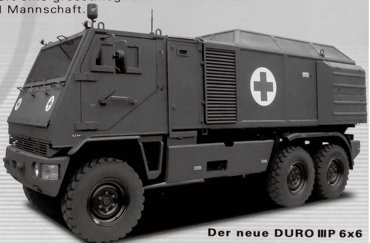
Der neue DURO III P 6x6

Die neu entwickelten MOWAG EAGLE IV und DURO III P bieten äusserst wirkungsvollen Ballistik- und Minenschutz bei geringem Gewicht sowie eine sehr hohe Gelände- und Strassenmobilität. Daraus resultiert eine grösstmögliche Sicherheit für Besatzung und Mannschaft.