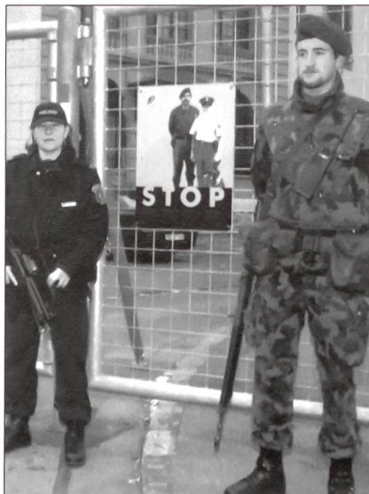
Erfolgreiche Einsätze setzen den Massstab.

Zur Rüstung wird festgestellt, dass das Schweizervolk am 18. Mai 2003 die Vorlage zur neuen Armee mit einer Dreiviertelmehrheit angenommen hat – dies auf der Grundlage, dass die personell kleiner werdende Armee diese Reduktion durch