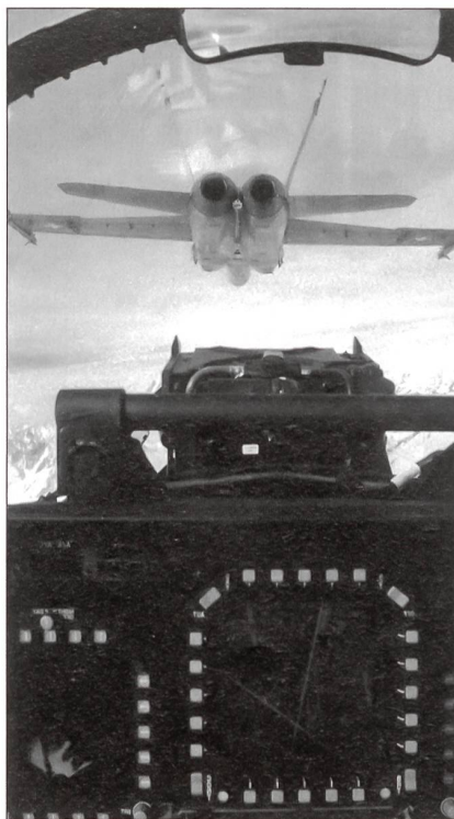
Den Luftraum schützen.

Nach wie vor bildet die militärische Weiterbildung für geeignete Schweizerinnen und Schweizer ein hervorragendes