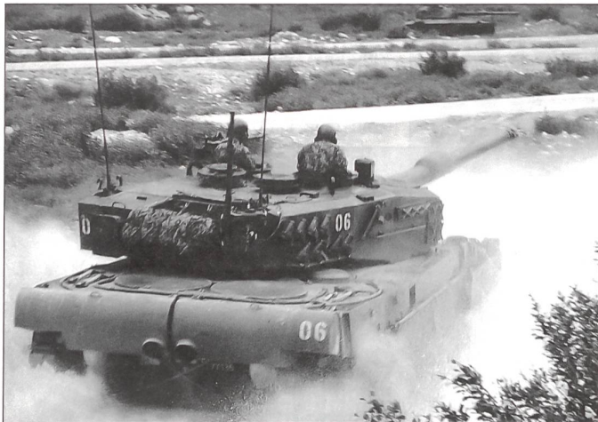
Demonstration der ausgezeichneten Beweglichkeit des Leopard-Panzers im Gelände.

kurze Nacht gehabt hätten! Am Morgen fand eine rund zweistündige Führung durch die ganze Festungsanlage statt. Alle waren tief beeindruckt von der Grösse der tief im Fels angelegten Festung mit eigener Wasserversorgung und Stromerzeugung. Die damaligen Gegner, wären sie in unfreundlicher Absicht über den Splügenpass in die Schweiz eingefallen, hätten sich wohl am Artilleriefort Crestawald die Zähne ausgebissen. In der heutigen Armee werden Festungen wie Crestawald nicht mehr gebraucht. Beweglichkeit ist heute Trumpf und deshalb sind starre Sperren keine wirklichen Sperren mehr. Als «Zeitzeuge» einer starken Sperre im Zweiten Weltkrieg hat das Artilleriewerk Crestawald seine Bedeutung aber nicht verloren.