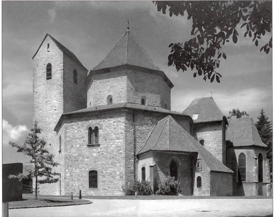
Südansicht der Kirche von Ottmarsheim.