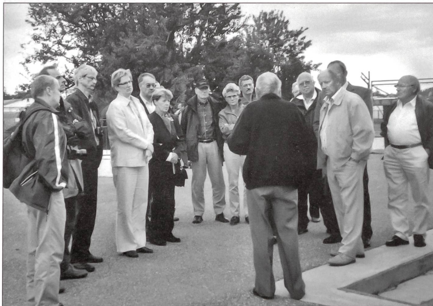
Interessierte Zuhörerschaft beim Bunker der Maginot-Linie.