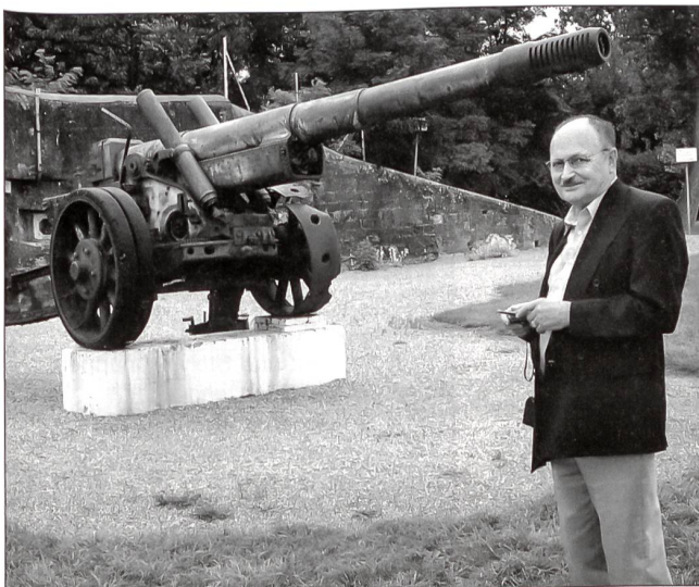
Der Genossenschaftspräsident in Pose.

Ein geologisch hochinteressantes Gebiet mit erloschenem Vulkan, aber auch Sand, denn einst reichte die Nordsee bis hierher. Deshalb gedeihen im leichten Sandboden Gemüse und Beeren besonders gut, vor allem Spargel. Man kann heute noch im Garten kleine Muscheln finden beim Umgraben der Beete, obwohl zwischenzeitlich auch die Gletscher schon einmal bis hierher vorgestossen waren und ihre eigenen Ablagerungen aus den Alpen hinterliessen. Köstlich die gewundene Eisenbahnlinie – einer Sauschwänzlebahn ebenbürtig –, die von Dorf zu Dorf führte und unzählige Male nach jedem Bogen die Strasse kreuzte. In Vogtsburg-Bischoffingen empfing uns das Hotel Restaurant Weinstube Steinbuck. An schön gedeckten Tischen durften wir uns niederlassen und ein feines Mittagessen geniessen. Der Service funktionierte auch