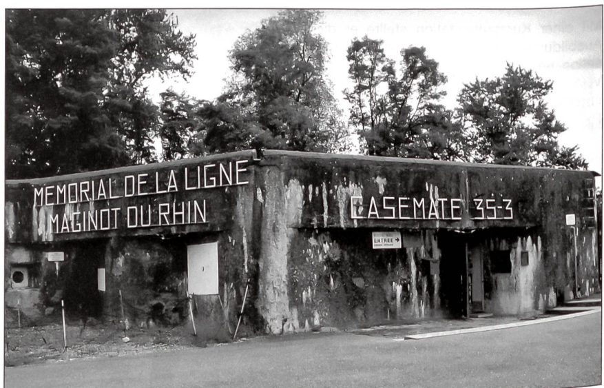
Am Eingang zum Bunker und zum kleinen Museum.

Wie an einem Sternmarsch trafen die Angemeldeten aus allen Richtungen der