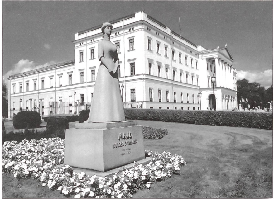
Das Kongelige Slott (Königsschloss).

Oslo ist Skandinaviens älteste Hauptstadt. Der Name geht zurück auf die beiden altnorwegischen Worte as, das Gott bedeutet, und lo mit der Bedeutung Wiese. Die