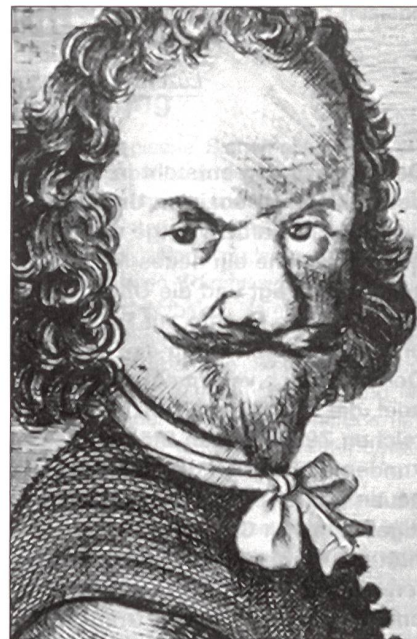
Luzerner Bauernführer Christian Schibi von Scholzmatt (Kupferstich; Zentralbibliothek, Zürich).