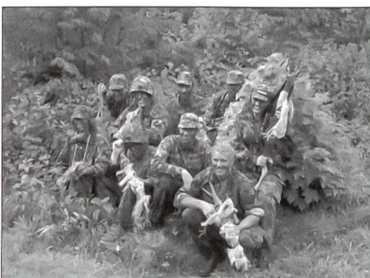
Einige Sniper aus dem Luzerner Kantonalen Unteroffiziersverband.

Punkt 1315 Uhr findet die Befehlsausgabe für die Truppführer statt. Beim zweiten Teil der Übung werden nun die einzelnen Elemente zusammengesetzt. Ziel ist es, den Gegner, der sich in einigen Kilometern Entfernung bei einem Kommandoposten aufhält, zu vernichten. Nach intensivem Studium der Karte machen sich die Trupps auf den Weg. Von den «gegnerischen Beobachtern», die durch die Übungsleitung im Gelände verteilt wurden, konnte kein Scharfschützen-trupp entdeckt werden.