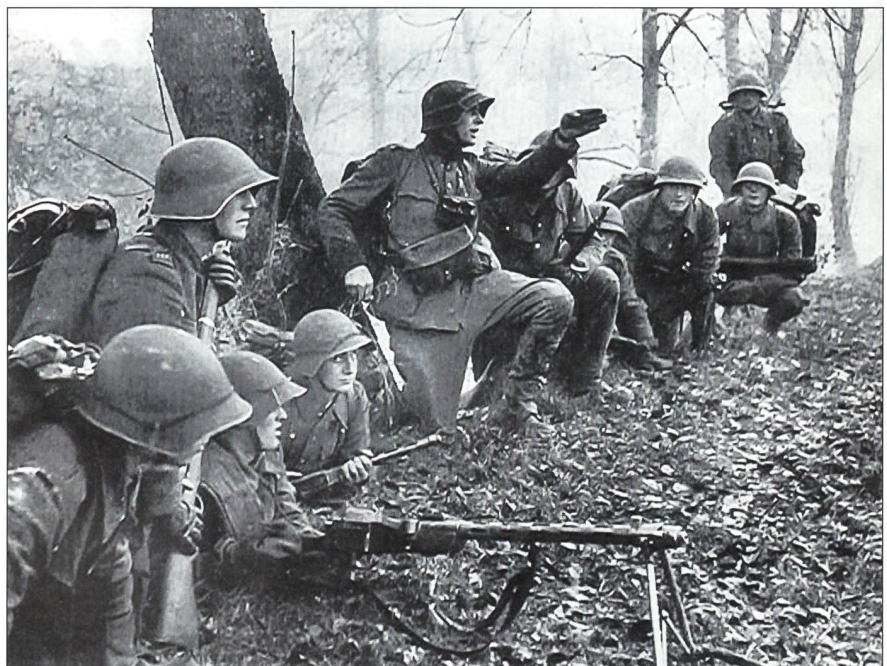
Von zeitloser Gültigkeit: Der Führer weist seine Untergebenen vor Ort und Aug in Aug in ihren Auftrag ein, dabei lässt er ihnen nach Möglichkeit einen kreativen Handlungsspielraum – und wird vorausgehen.

nie brauchen, z.B. Einsatz von Handgranaten, Schiessen mit Sturmgewehr, Ausbildung im ABC-Bereich (Schutzmaske). Die neue Armee XXI bietet uns viele Chancen und grosse Herausforderungen. Der Auftrag der Armee steht in der Bundesverfassung. Die Armee schützt unser Land und unsere Bevölkerung. Im Artikel 6 der Bundesverfassung wird die «individuelle und gesellschaftliche Verantwortung» erklärt. Hier lese ich, dass ein Mensch mit mehr Talenten sich auch für unsere Gesellschaft stärker einsetzen muss. Diese Gedanken stärken einen Führer. Man spürt als Führer seinen Auftrag und seine Verantwortung.