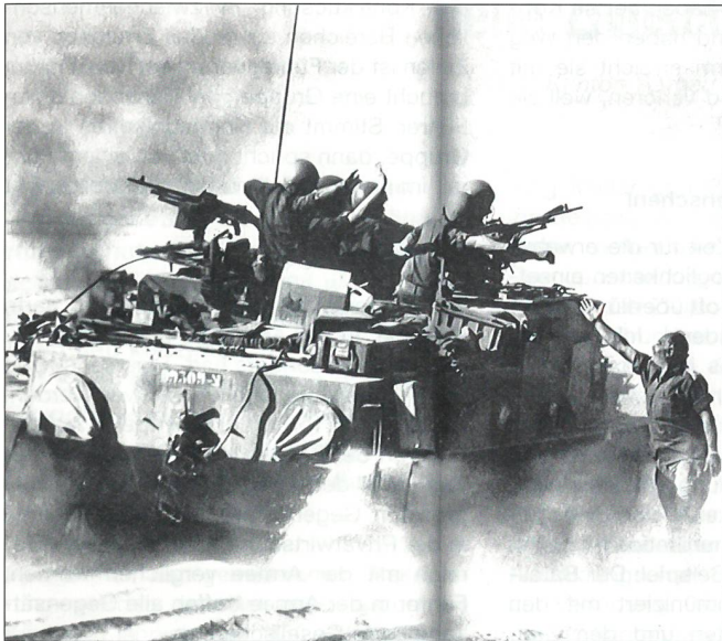
Sinai, Oktoberkrieg 1973: Zufallsbegegnung eines Führers an vorderster Front mit einer seiner Panzerbesatzungen; Minuten später waren die Soldaten im Panzer tot, gefallen ...