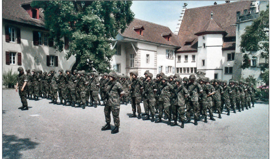
100 Absolventen InfRS Aarau melden sich zur Durchdiener-Infanterie-Bereitschaftskompanie 104.

«Mit der Zeremonie der Fahnenübergabe feiern wir ein Ereignis, das für Sie von Bedeutung ist: Der Beginn der zweiten