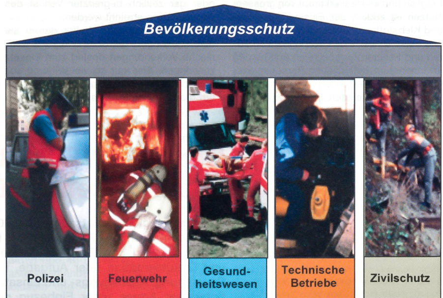
Abb. 1: Das System des Bevölkerungsschutzes mit den fünf Partnerorganisationen.

handelt werden Themen wie «Bevölkerungsschutz / Regionale Führungsorgane», «Übersicht über die Partnerorganisationen», «Infrastruktur und Organisation eines RFO», «Warnung und Alarmierung» sowie «Einführung in die Stabsarbeit». Teilnehmer sind in erster Linie alle RFO-Mitglieder. Zusätzlich können an diesem ersten Kurstag aber auch Vertreter der politischen Behörden, Feuerwehrkommandanten der Bevölkerungsschutzregion usw. teilnehmen. Der zweite Kurstag ist ein Halbtage (Vormittag) und richtet sich ausschliesslich an die Chefs und Stabschefs sowie an den Chef Lage. Als Leitung des RFO haben diese drei Personen ganz spezifische Aufgaben.