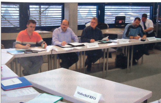
Üben von Stabsarbeit an einem Rapport.

In welchem Rahmen diese Unterstützung im Einzelnen möglich sein wird, hängt vom Ergebnis einer Umfrage ab, die das BABS zurzeit bei den Kantonen durchführt. Die bisherigen Signale aus Bern sind als sehr positiv zu werten. +