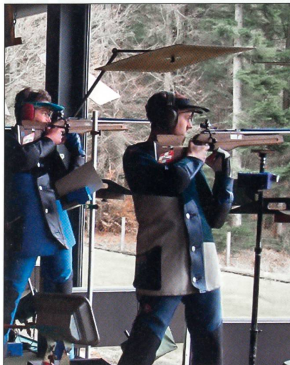
Schiesswesen ausser Dienst.

Der Schweizer Schiesssportverband mit seinen rund 200 000 Mitgliedern ist der Ansprechpartner der SAT im Zusammenhang mit dem Schiesswesen ausser Dienst. Nicht nur das Eidgenössische Schützenfest im Jahre 2005 mit dem Armeewettkampf ist ein Thema, sondern auch verschiedene Dienstleistungen, welche dieser Verband der Armee anbietet. Es sind dies: