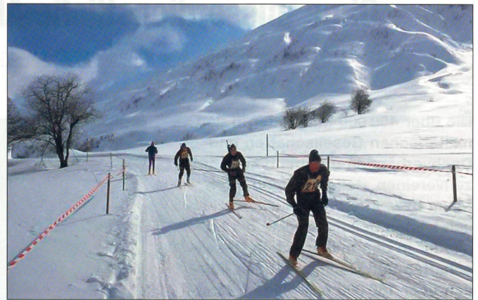
Andermatt, Freiwilliger Winter-Militär-Sportkurs.