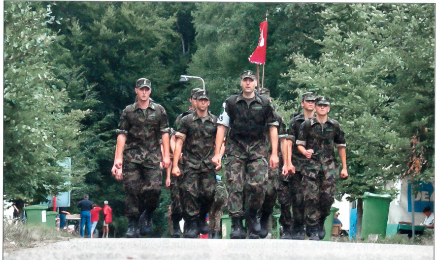
Wir marschieren in Nijmegen/Holland.

gement eines jeden einzelnen Verbandes und ihrer Vereine ab.»