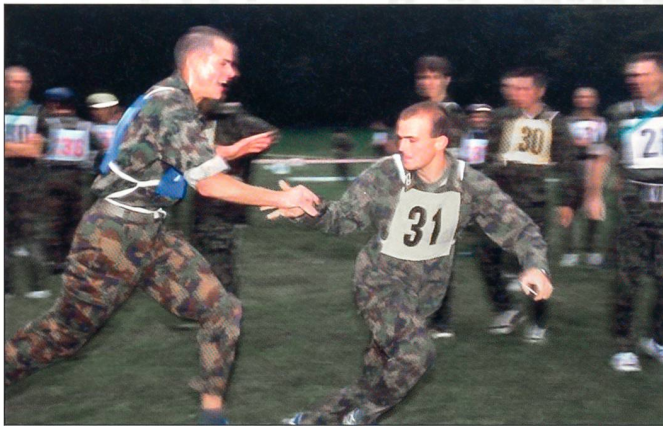
Sommer-Armeemeisterschaften, Action pur!