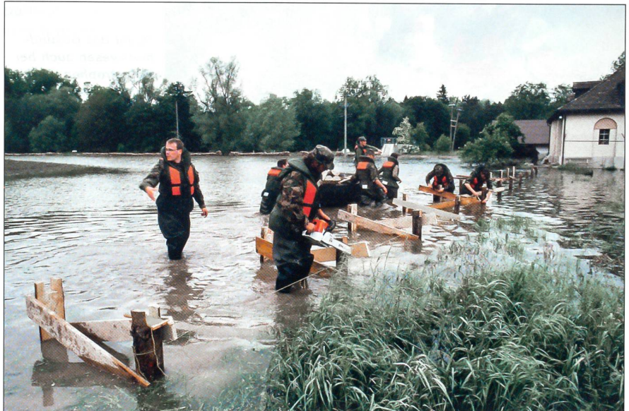
Subsidiärer Hilfeinsatz in Belp (BE), 1999: Angehörige der Rettungstruppen errichten zu den anliegenden Häusern Laufstege.

Die Hauptkonferenz begann mit Gedanken über das Verbundsystem Innere Sicherheit Schweiz, vermittelt durch Urs von Däniken, Vizedirektor beim Bundesamt für Polizei (fedpol). Peter Schneider, Generalsekretär der Feuerwehrkoordination Schweiz, stellte anschliessend die neuen Strukturen im Schweizer Feuerwehrewesen vor. Die Vertreter von Polizei und Feuerwehr zeigten