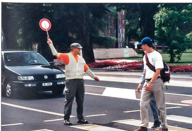
Einsätze zu Gunsten der Gemeinschaft, insbesondere bei Grossanlässen, haben mit der neuen Gesetzgebung eine klare rechtliche Grundlage erhalten. Erste positive Erfahrungen wurden gemacht.

Das Sicherheitsnetz der Schweiz Polycom bietet nach den Worten von alt Regierungsrat (BL) Andreas Koellreuter, Präsident des Ausschusses Telematik, die Chance, dass erstmals alle Partner des Bevölkerungsschutzes bei Unfällen oder Katastrophen reibungslos miteinander kommunizieren können. Die Realisierung der Teilnetze wird kantonsweise geplant. Ziel des Projekts Nationaler ABC-Schutz ist ein gesamtheitliches und abgestimmtes Vorgehen bei atomaren, biologischen und chemischen Ereignissen, den so genannten ABC-Ereignissen. Bis Ende 2005 soll ein Konzept für den Nationalen ABC-Schutz bestehen, erklärte Bernhard Brunner, Präsident der Kommission ABC. Jürg Bühler vom Bundesamt für Polizei (fedpol) informierte die Konferenzteilneh-