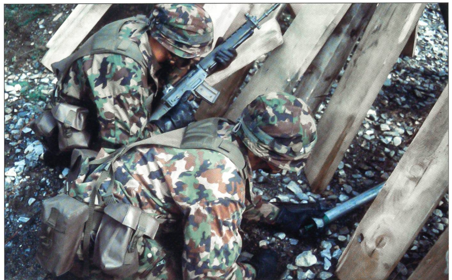
Grenadiere bereiten die Sprengung eines Hindernisses vor.

«Das Umfeld, in dem der Grenadier heute seine Aufgabe erfüllt, stellt aber neue Anforderungen und verlangt somit eine neue Gewichtung dieser Grundwerte, wie etwa die Fähigkeit, sich rasch auf neue Situationen einstellen zu können, im Gesamtrahmen mitdenken zu können und sich dabei jederzeit seiner Aufgabe bewusst zu sein respektive des zu erreichenden Ziels. Dieses extreme Zielbewusstsein führt zu einem Umdenken im Rahmen des Einsatzes, in dem alles auf die Hauptaufgabe auszurichten ist und die gesamte Aktion sich danach auszurichten hat. Dass dies alles unter höchster physischer und psychischer Belastung geschieht, versteht sich von selbst.»