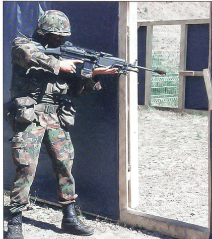
Neue Waffe des Grenadiertrupps: das 5,6-mm-Leichte-Maschinengewehr 05, welches der Schütze wie seine persönliche Waffe einsetzt.