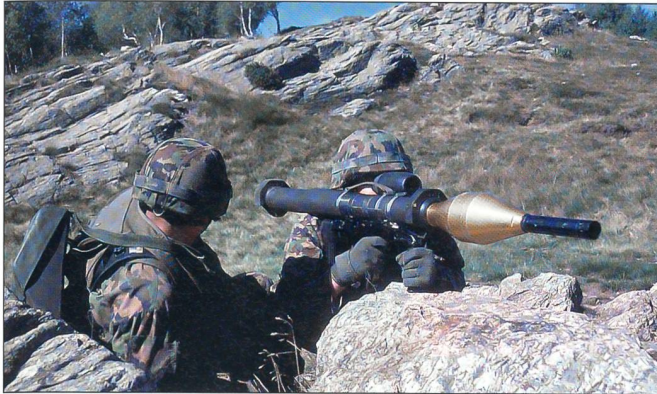
Grenadiere trainieren den Stellungenbezug mit einer Panzerfaust.

geradezu anbietet. Der Kanton Tessin war ja schon von Beginn weg Gastgeber für die