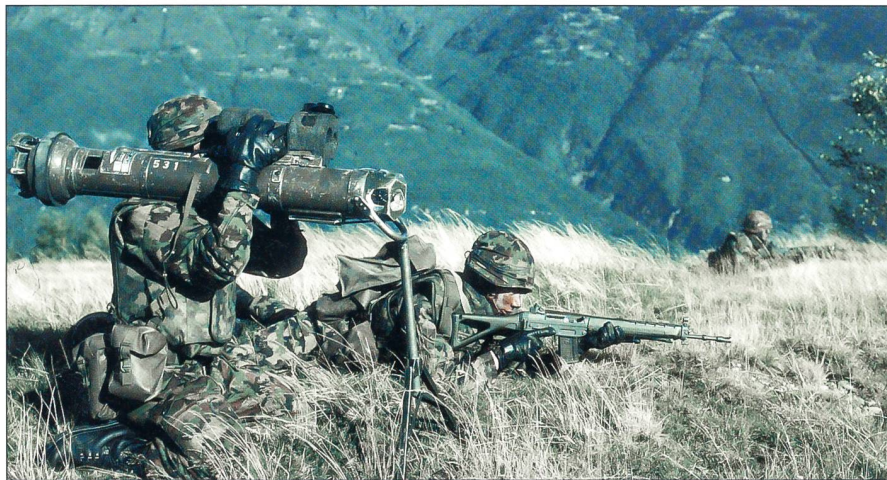
Der Grenadierunterstützungszug der Grenadierkompanie verfügt über 2 Grenadier-Panzerabwehrgruppen. PAL-Grenadiere gehen in Stellung.

Die Lösung drängte sich auf, weil die Kaderausbildung ebenfalls neu geregelt wurde. Bereits nach neun Wochen Rekrutenschule treten die Kaderanwärter nach neuem System in die Kaderschulen über. Dabei werden die Offiziers- und Unteroffiziersanwärter vor allem zu Führungspersönlichkeiten, zudem aber auch in den