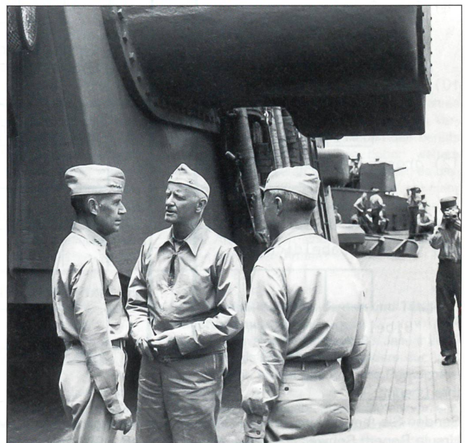
Admiral Raymond Spruance, der Sieger von Midway, war der Kommandant der 5. US-Flotte und unmittelbarer Verantwortlicher in der Schlacht um Iwo Jima. Das Bild zeigt ihn (links) bei einer Besprechung mit dem Oberbefehlshaber im Pazifik, Admiral Chester Nimitz (Mitte), und Konteradmiral Forrest Sherman (rechts) am 8. April 1944 auf dem Schlachtschiff «USS New Jersey».

Letztlich endete der Kampf um Iwo Jima für die Amerikaner erfolgreich. Aber für welchen Blutzoll! Trotz dem wichtigen strategischen Erfolg waren einige erhebliche Fehler begangen worden: Der Artilleriebeschuss der Insel war unzureichend, die Geländebeschaffenheit und die Bunkersysteme waren von den Nachrichtendienstern nicht oder unzureichend aufgeklärt worden. Die Amerikaner waren nicht auf die neue japanische Taktik der tief gestaffelten Verteidigung aus Bunkersystemen (ohne die auf Saipan, Tarawa und Peleliu erfolgten Selbstmordangriffe) vorbereitet. Die japanische Besatzung auf der Insel war um bis zu 70% unterschätzt worden. Aufgrund all dieser Faktoren waren die Verluste der Amerikaner um bis zu 80% höher als erwartet. Ein Drittel der an der Landung beteiligten 70 000 Marines fiel aus verschiedenen Gründen aus. Diese erschreckenden Zahlen sollten eine Warnung für die noch bevorstehenden Operationen zur Niederschlagung des Kaiserlichen Imperiums, insbesondere für die Schlussoffensive gegen Okinawa, sein. ☒