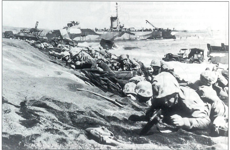
Marines der 4. Marineinfanterie Division werden am Morgen des 19. Februar 1945 bei der Landung am Blue Beach auf Iwo Jima von gegnerischem Feuer niedergehalten. Der weiche, aschenförmige Boden behinderte das Vorrücken der schwer bepäckten Marines ganz erheblich. Für viele Marines war es die vierte amphibische Landung in nur 13 Monaten.

Iwo Jima mit nur 21 km 2 Fläche wurde vom japanischen Generalleutnant Kuribayashi und 23 000 gut ausgerüsteten Soldaten mit 361 Geschützen und 22 Panzern verteidigt. Er bezeichnete Iwo Jima als Tor zu Japan. Selbst von amerikanischen Kreisen wird diesem Offizier, der zwei Jahre als Militärattaché in Washington gedient und direkten Zugang zum Kaiser hatte, Brillanz attestiert. Entgegen dem Rat vieler Offiziere hatte er die Hauptverteidigung nicht bereits am Strand errichtet, sondern eine tief gestaffelte Verteidigung mit einem hoch komplexen System von Tunneln von insgesamt 18 km Länge und von 1500 Bunkern angelegt. Kuribayashi verzichtete zu-