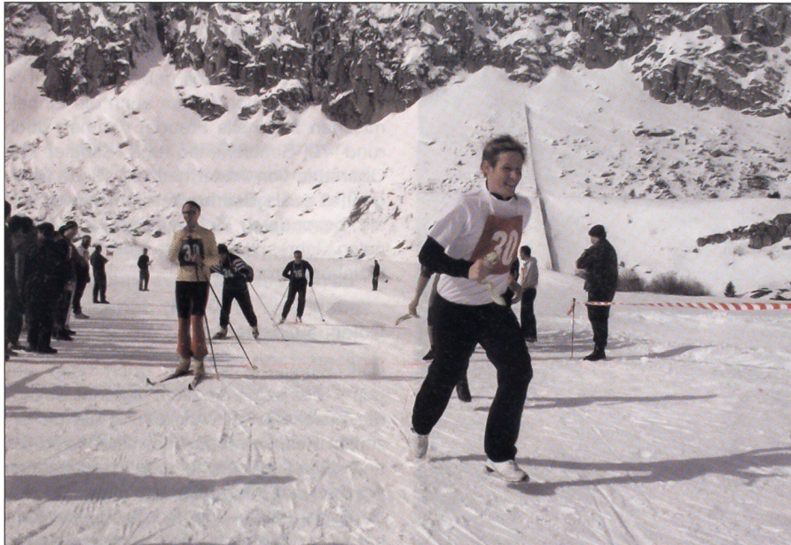
Übergaberaum beim Staffellauf.