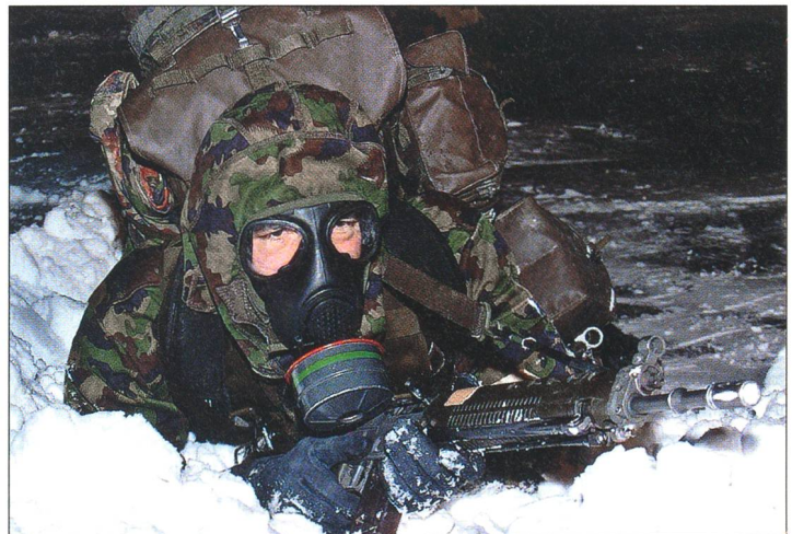
Ist ein Schuss möglich?