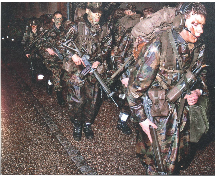
Mir nach, Marsch!