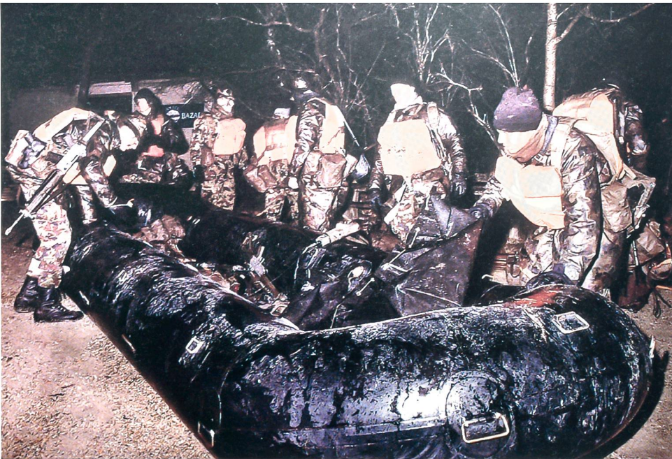
Bereit zur Paddelarbeit nach Erlach.