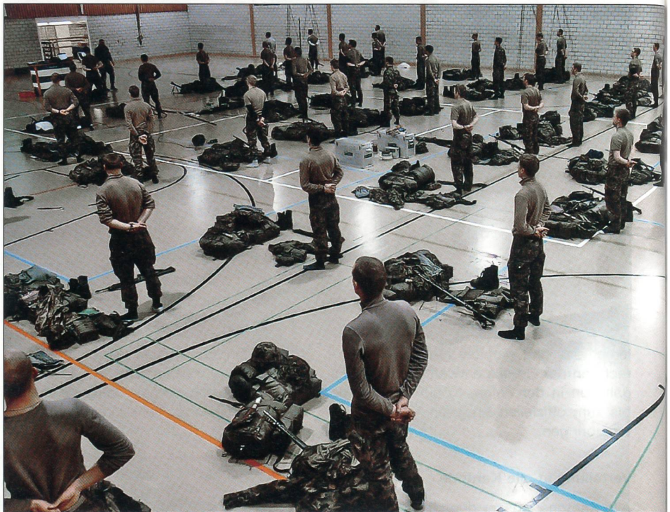
Material- und Kleiderkontrolle: kein Gramm zu viel, kein Gramm zu wenig.

Das Paradestück jeder Offiziersschule ist auch in der neuen Schweizer Armee der Marsch über hundert Kilometer, welcher