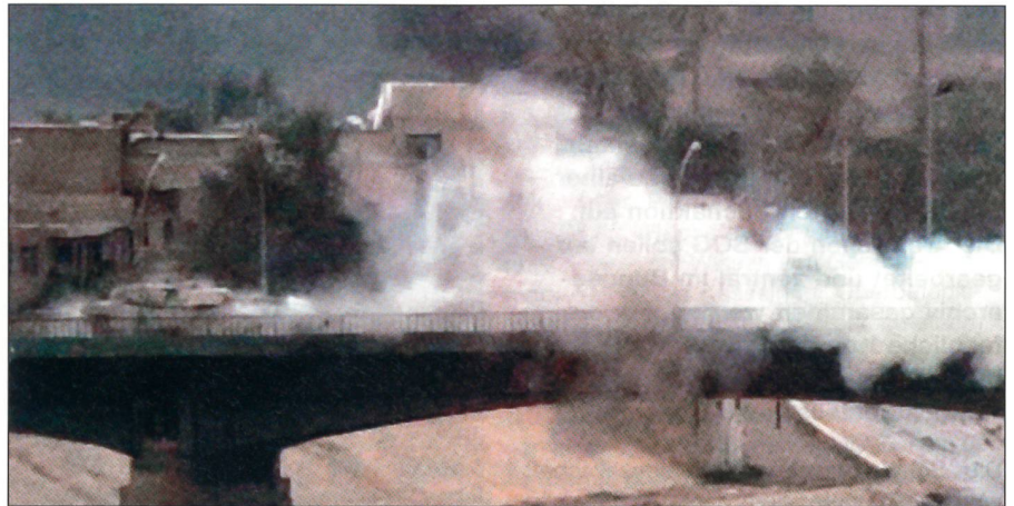
Kampfpanzer Abrams M-1A1 auf der Humhuriya-Brücke in Bagdad.