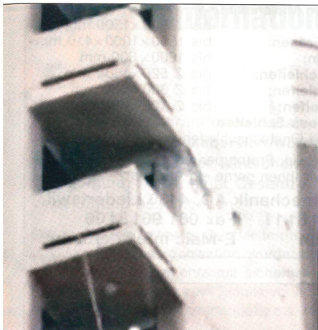
Granateneinschlag am Hotel Palestine in Bagdad.

war wie in Hollywood», schwärmte nach dem Krieg Patrick Baz, der seine Bilder für Agence France Presse schoss, «sie sahen uns, und wir sahen sie».