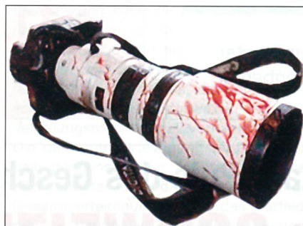
Eine der Kameras, die von den Panzerschützen für Beobachtungsfernrohre gehalten wurden.

Rasch geben nun Perkins, sein Vorgesetzter Blount und der offizielle Sprecher Brooks ihre Version ab, wonach die Task Force 4-64 von der Hotel-Lobby aus beschossen worden sei. Im Palestine widersprechen die Journalisten vehement. Das französische Fernsehen spielt ein Tonband ab, auf dem für die fragliche Zeit rund um das Hotel keinerlei Gefechtslärm ertönt.