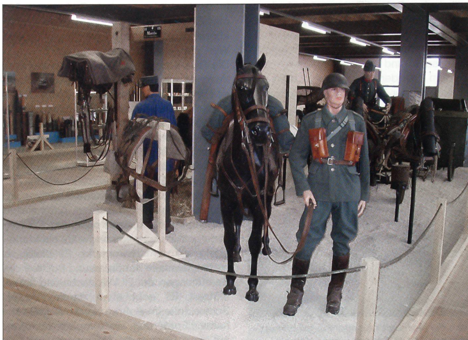
Kavallerie und Train.