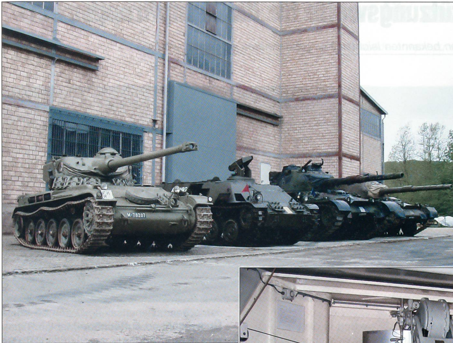
Aussenaufnahme Museum mit Panzerreihe.

aus der Zeit des Zweiten Weltkrieges. Nach all den Eindrücken lädt das tief unter dem Boden gelegene «Festungsbeizli Barbara» zu Speis und Trank ein.