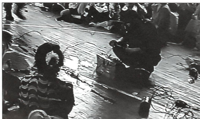
1. September 2004: Auf dem Boden der Turnhalle von Beslan montiert ein Terrorist eine Sprengladung.

In einer ersten Verlautbarung berichten die nordossetischen Behörden von 354 Geiseln. Früh wird aber bekannt, dass diese Zahl völlig falsch ist. Am Morgen fanden sich zum ersten Unterrichtstag 890 Schüler ein, zusammen mit 59 Lehrern. Festgehalten werden überdies zahlreiche Eltern,