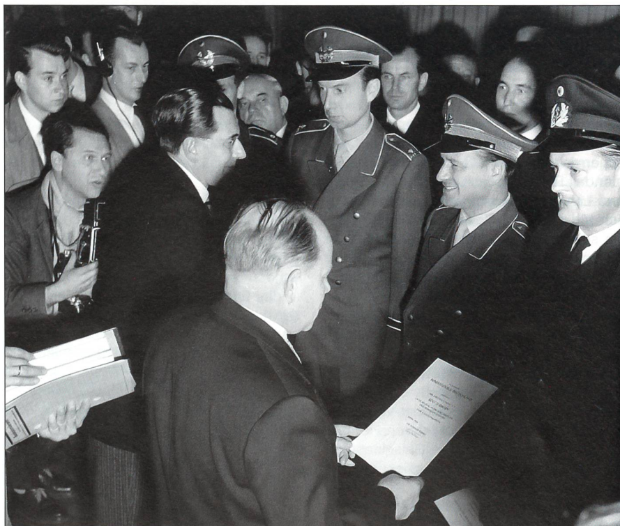
Ernennung der ersten Soldaten.

7. Juni ist gewählt worden, weil Theodor Blank 1955 zum ersten Verteidigungsminister der Bundesrepublik Deutschland ernannt wurde. Aus dem «Beauftragter des Bundeskanzlers für die mit der Vermehrung der alliierten Truppen zusammenhängenden Fragen», im allgemeinen Sprachgebrauch «Amt Blank» genannt, wird damit das «Bundesministerium für Verteidigung».