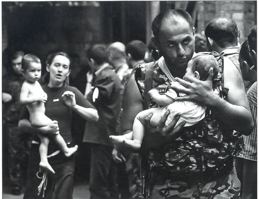
Ein russischer Soldat birgt einen Säugling, hinter ihm eine Mutter mit ihrem Kind.

Die zivilen Behörden stellen einen Krisenstab auf. An der Spitze umfasst der Stab den örtlichen Geheimdienstchef Walerij