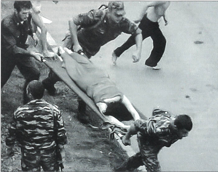
3. September 2004: Soldaten tragen eine verwundete Frau aus der befreiten Turnhalle.

sodass die Geiselnzahl deutlich über 1000 liegen muss. In der Kominternstrasse mutmassen Angehörige der Geiseln, die Behörden hielten die Zahl tief, damit sie ihre Angaben nach einem Sturm auf die Schule nach unten manipulieren könnten. Selbst die Geiselnnehmer protestieren, als sie über ihre Radioempfänger die falschen Angaben hören. Später wird die Zahl anhand von Klassenbüchern und Familienlisten auf rund 1350 Geiseln angesetzt.