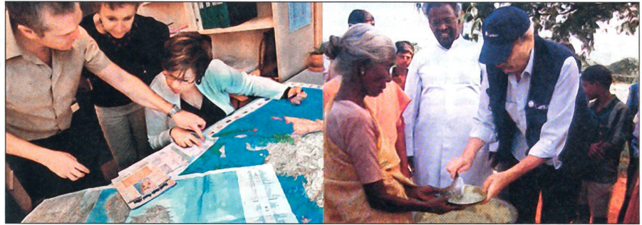
Die weltweite Soforthilfe ist in vollem Gange: Helfer koordinieren ihren Einsatz (links) und verteilen Essen an Überlebende (rechts).

Als Sofortmassnahme wurden in den vergangenen 4 Jahren 322 bestehende Bundesbauten und 400 Brücken in den besonders gefährdeten Gebieten inventarisiert und auf ihre Erdbebensicherheit überprüft. Bei 38 zusätzlich geprüften Sanierungs-