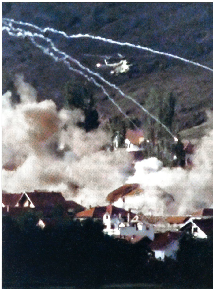
Krieg in Europa 2001: Luftangriff in Mazedonien.

Doch, entgegen den Erwartungen der Naiven oder Leichtsinigen – die wie etwa unsere Linke im März 1991 zwei Initiativen beschloss, die die Verteidigung gravierend zu schwächen geeignet waren, und die