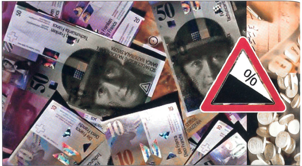
Die Armee ist zu Sparmassnahmen gezwungen.