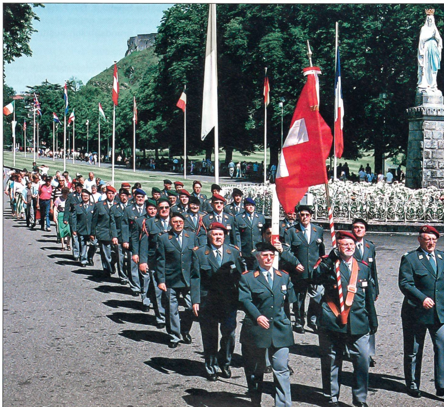
Die Schweizer Delegation auf dem Marsch zu einer gemeinsamen Feier.

Es ist Ehrensache jeder Nation, mit einer Delegation an der Krankenprozession teilzunehmen. So nahm auch eine Schweizer Vertretung daran teil. Es ist immer wieder beeindruckend, mit welcher Hingabe die Kranken und Behinderten von ihren Angehörigen und von vielen Helfern nach Lourdes gebracht und betreut werden. Auch wenn man nicht mit einer Heilung