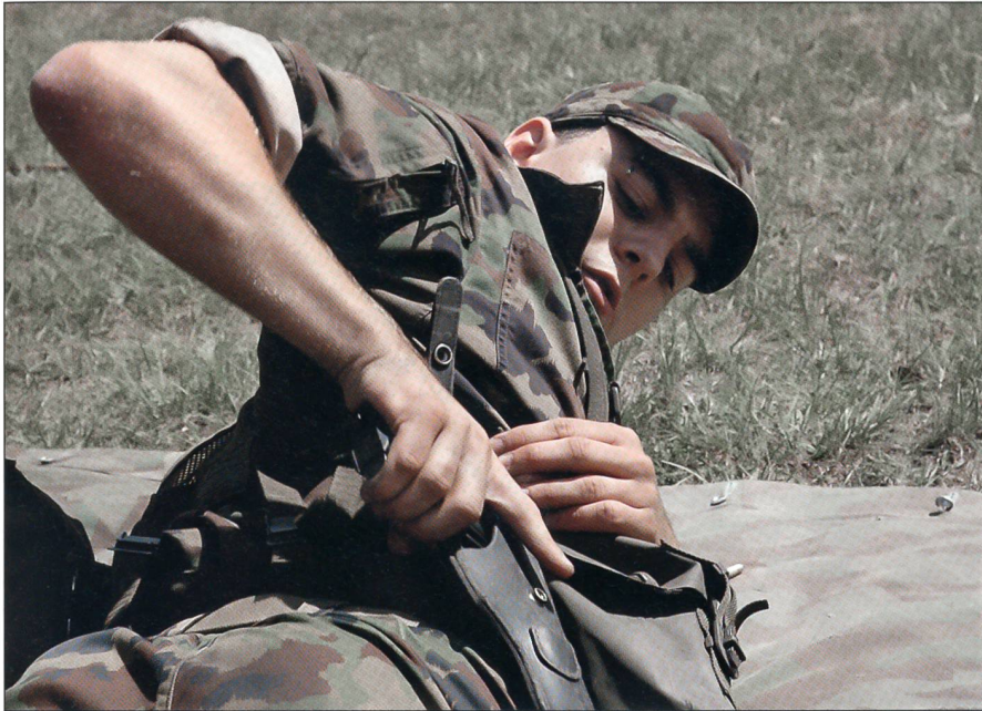
Schnelle Reaktion beim Pistolendrill.

lastbar sein.» Der Weg zum Hauptfeldweibel beginnt mit der siebenwöchigen allgemeinen Grundausbildung in der Rekrutenschule und führt über den Höheren Unteroffizierslehrgang zum siebenwöchigen Praktikum und zum fünf- bis achtwöchigen Praktischen Dienst (je nach Waffengattung). In der Ausbildung zum Hauptfeldweibel liegen die Schwergewichte auf der Menschen- und Personalführung, der Fachtechnik im Bereich Einheitsfeldweibel, der Führung des Logistikzuges, der Gefechtstechnik und der Taktik. Am Besuchstag gaben die angehenden Hauptfeldweibel Einblick in ihre Pistolenausbildung, die im Zeichen ei-