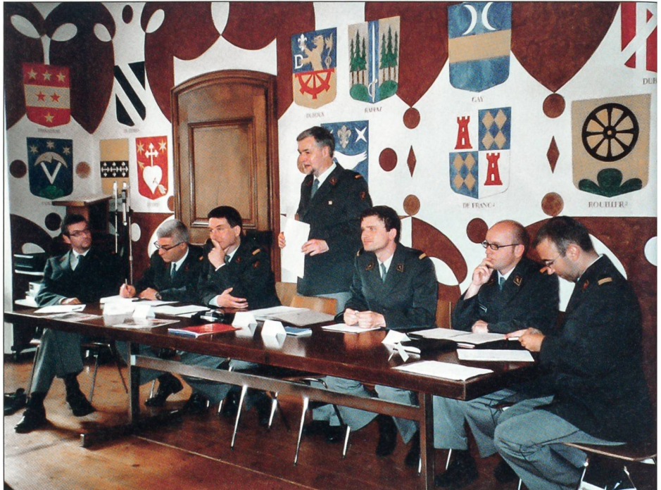
Der Vorstand im Saal des Rathauses von St-Maurice.

Für das seelische Wohl sorgten die Gastgeber und die Mitglieder, für das leibliche Wohl die Mitarbeiter im Foyer franciscain,