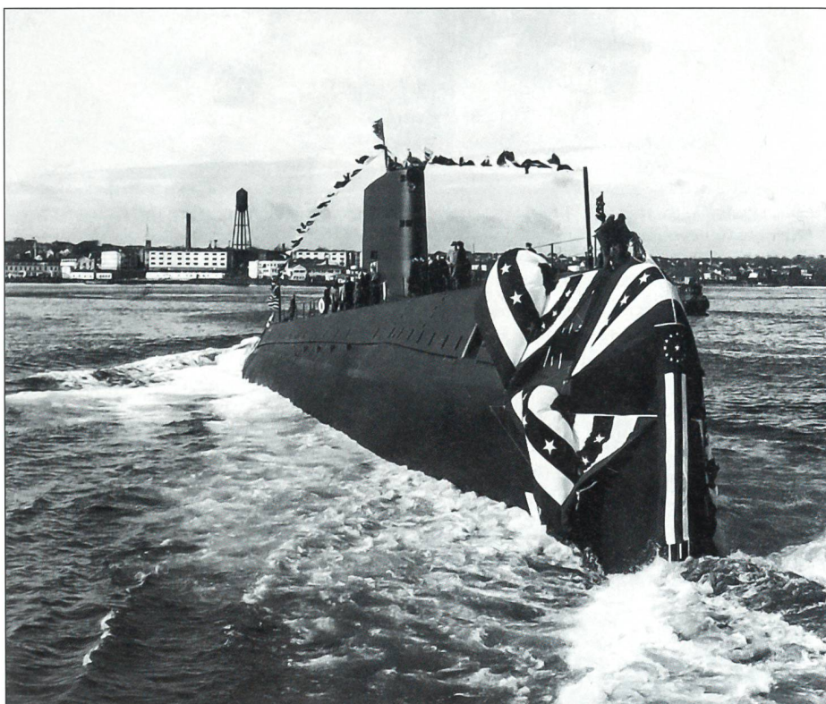
Die USS Nautilus (SSN-571) beim Stapellauf am 21. Januar 1954 in Groton, Connecticut. Nach dem Zerbersten der Champagnerflasche am Bug gleitet sie in den Thames Fluss.

Nicht so bei den Kriegsmarinern. Fortan sollten vor allem im amerikanischen U-Boot-Bau praktisch alle Einheiten bis zum heutigen Tag mit nuklearem Antrieb versehen werden, auch die sowjetischen, dann russischen, französischen und britischen U-Boote verfügen mehrheitlich über solchen Antrieb. China und Indien bauen solche Boote. In den 60er- und 70er-Jahren bauten die Amerikaner auch Kreuzer und Zerstörer mit Nuklearantrieb, die heute allerdings alle ausgemustert sind. 1964 fuhr eine nukleare Kampfgruppe der U. S. Navy, bestehend aus dem Flugzeugträger USS Enterprise, dem Kreuzer USS Long Beach und dem Zerstörer USS Bainbridge, in der Operation «Sea Orbit» aus