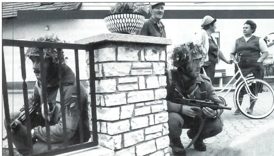
Landesverteidigung im Deutschland des Kalten Krieges: Reservesoldaten während einer Grossübung in Süddeutschland.