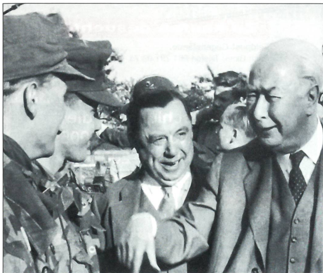
«Nun siegt mal schön» 1958: Zwischen Ironie und Skepsis – mit diesem Satz gab Bundespräsident Heuss (rechts) die Stimmung in der Bevölkerung den Soldaten gegenüber wieder.

Berliner Mauer am 9. November 1989 ein Ende. Die Ereignisse im deutschen Schicksalsjahr 1990 verliefen dann so schnell, dass sie in ihren Auswirkungen gar nicht richtig erfasst werden konnten. Im März 1990 fanden die ersten freien Wahlen auf dem Territorium der DDR seit 1932 statt. Zum 1. Juli trat der Staatsvertrag zwischen der Bundesrepublik und der DDR zur Währungs-, Wirtschafts- und Sozialunion in Kraft. Am 15./16. Juli besprachen Gorbatschow und Kohl im Kaukasus die Modalitäten der Wiedervereinigung Deutschlands. Die Reduzierung der Bundeswehr auf 370 000 Mann bis 1994 wurde dabei festgelegt. Ab Mitte August nahm ein Verbindungskommando des Bundesministeriums der Verteidigung in Strausberg im Ministerium für Abrüstung und Verteidigung, das der in der DDR-Friedensbewegung tätige Pfarrer Rainer Eppelmann führte, die Arbeit auf. Am 12. September wurden die «Zwei-plus-Vier-Verhandlungen» abgeschlossen und der Deutschland-Vertrag