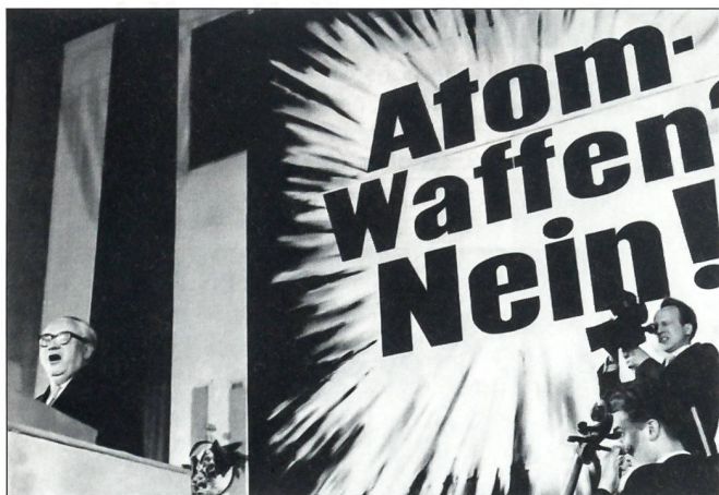
Veranstaltung gegen die nukleare Bewaffnung der Bundeswehr Ende der 50er-Jahre: «Der Protestbewegung 'Kampf dem Atomtod' seinerzeit habe ich als junger Mensch aus tiefster Überzeugung angehört.»

Der erste Grossauftrag für ein Waffensystem des Heeres war der Lizenzbau für den Schützenpanzer HS 30, ein mit grossen Mängeln belastetes Fahrzeug. Die deutsche Rüstungsindustrie entwickelte sich wieder und hat im Laufe der Jahre Waffensysteme wie den Kampfpanzer LEOPARD, den Jagdpanzer JAGUAR, den Flugabwehrpanzer GEPARD, den Aufklärungspanzer LUCHS, den Spürpanzer FUCHS und anderes Grossgerät geliefert.