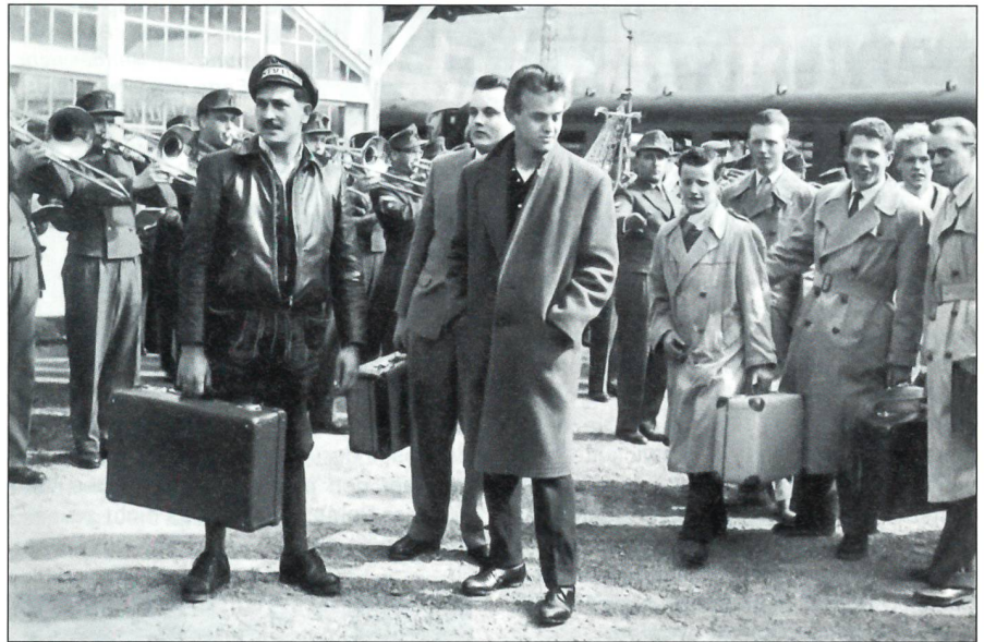
Verstärkung für das Freiwilligenheer: Ankunft der ersten Wehrpflichtigen (Jahrgang 1937) auf dem Bahnhof in Mittenwald am 1. April 1957.

Mit dem Wechsel von Theodor Blank zu Franz Josef Strauss im Oktober 1956 wollte Bundeskanzler Konrad Adenauer den Aufbau der Streitkräfte forcieren. Das