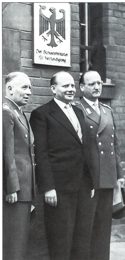
Ein völlig neues Kapitel in der Geschichte deutscher Streitkräfte hat begonnen: Bundesverteidigungsminister Theodor Blank, flankiert von den frisch berufenen Bundeswehrgenerälen Adolf Heusinger und Alfred Speidel, vor dem Bundesverteidigungsministerium in Bonn nach der Ernennung der ersten 101 Soldaten am 12. November 1955 in der Ermekeilkasernen.

Mai 1974 Bundeskanzler wurde, folgte ihm Georg Leber auf die Hardthöhe. Die neue Politik hatte kaum Einfluss auf das Militär. Die Einbindung in die NATO und die Erfordernisse der Verteidigungsfähigkeit gegenüber den massiven Kräften des Warschauer Paktes liessen das nicht zu.