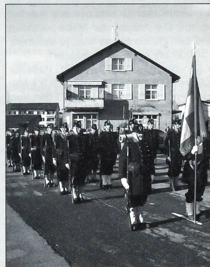
Die Compagnie 1861 marschiert auch am diesjährigen Ustertag aus: Bereit für das Spalier auf der Kirchtreppe.