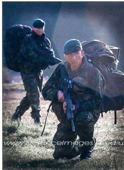
Die Spezialtruppen aller Teilstreitkräfte (im Bild Royal Marines) werden verstärkt.

Im Herzen der Transformation steht die Schaffung von netzwerkgestützten Fähig-