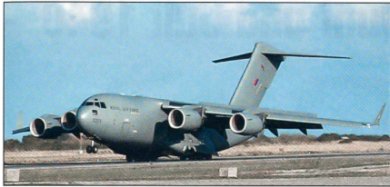
Die Bedeutung der strategischen Lufttransportfähigkeit wird durch den Kauf der geleasten C-17A unterstrichen.

der Neugewichtung mit «Mittleren» und «Leichten» Truppen bleiben der Kampfpanzer Challenger 2, der Schützenpanzer Warrior und das Artilleriesystem AS 90 «die kampfscheidenden Geräte zumindest für einige Dekaden», wird von der Führung erklärt.