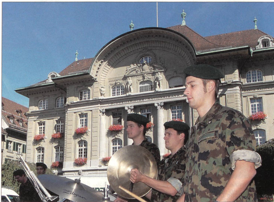
Neben den Einsätzen für Bund und Kantone und elegante Saalkonzerte für die Bevölkerung gibt jedes Spiel noch diverse Platzkonzerte, wie hier auf dem Bundesplatz. Dabei kommen breite Bevölkerungsschichten wie auch Touristen in den Genuss der militärmusikalischen Darbietungen.

Nun, um schon am Anfang keine falschen Schlüsse aufkommen zu lassen: Selbstverständlich klappte am Schluss alles irgendwie. Alle Platzkonzerte (in diesem WK waren es gleich achtzehn – unter anderem einige Platzkonzerte in Altersheimen und Fahnenübernahmen) und alle drei grossen Saalkonzerte fanden programmgemäss statt, wenn auch zuweilen einiges improvisiert werden musste: Anstatt der Oboen kamen einfach vermehrt die Klarinetten zum Einsatz, anstatt der grossen Trommel wurde diejenige des Drumsets verwendet. Und es klappte vorzüglich: Die Musiker waren zum Teil dermassen gut, dass nur