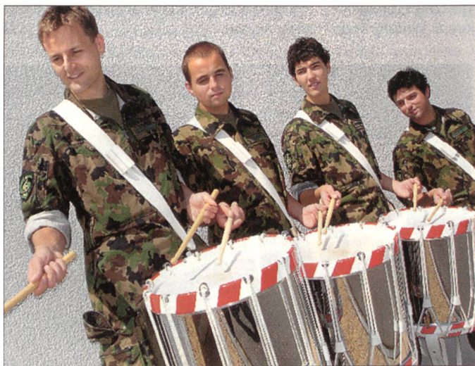
Tambouren lassen sich schlecht in klassische Werke (z. B. Beethoven) integrieren. Daher wird ihnen bei Platz- und Saalkonzerten eigener Gestaltungsraum überlassen –, den sie mit Musikpower sondergleichen füllen. Sie sind Stimmungsmacher und von der Schweizer Militärmusik nicht wegzudenken.

Klang bei einem Truppenspiel höchste Bedeutung zu. Oberleutnant Filippini: «An den Saalkonzerten werden wir die Yorkshire Ballad von James Barnes aufführen.