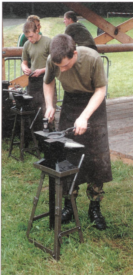
Starke Männer an einer Feld-Hufschmiedsstelle.

Die Trainsoldaten: Trainpferde werden üblicherweise dort eingesetzt, wo Fahrzeuge oder Helikopter nicht mehr verwendet werden können. So müssen Mannschaft und Pferde in schwierigem Gelände Transportleistungen zugunsten der Truppe oder zivilen Behörden erbringen. Die Ausbildung sieht in erster Linie die Pferdepflege sowie die korrekten Transportarten vor. Da das richtige Beladen der Tiere, das Basten, und die Transporte in unwegsamem Gelände im Sand nicht realitätsgetreu geübt werden können, werden diese praktischen Einsätze entweder oberhalb Boltigen im Simmental oder rund um Andermatt geübt. Die Trainsoldaten müssen stets in der Lage sein, die ihnen anvertrauten Tiere sicher zu führen und sich situationsgerecht zu verhalten.