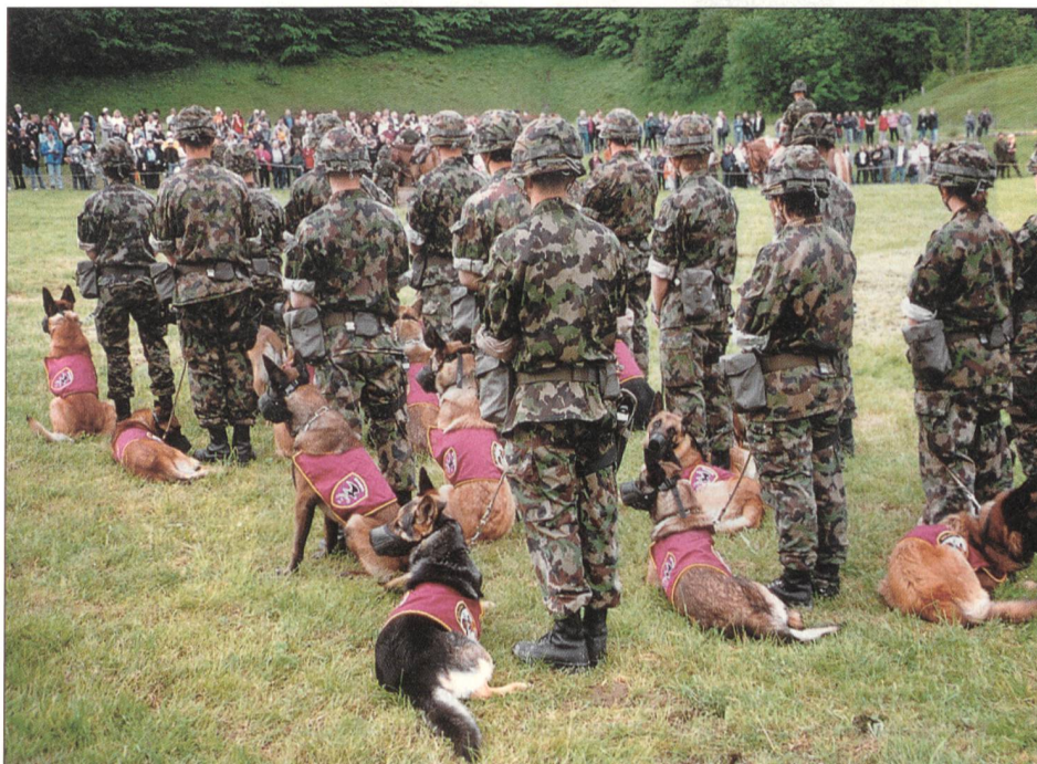
Der Hundeführerzug der RS 57-1/05 mit ihren Diensthunden.

In fast historisch anmutenden Gebäuden untergebracht sind sowohl Ställe, Büros und etwas moderner die Truppenunterkunft. Am 10. Juni 2004 nahm das neue Zentrum als Teil des Lehrverbandes Logistik 2 im Sand seinen Betrieb auf. Seither