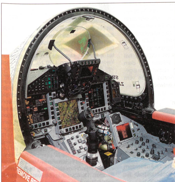
Das Layout des Cockpits des Eurofighter erleichtert dem Piloten dank modernsten elektronischen Hilfen die Erfüllung des Auftrages. Auf den verschiedenen Bildschirmen können alle wichtigen Informationen abgerufen werden.

Nach dem Teambildungsprozess und der Schulung in der Prozessarbeit hat das SUZ EF den operationellen Betrieb im April 2004 – mit dem Beginn des Flugbetriebes mit dem Eurofighter beim ersten deutschen Geschwader (JG 73 «S» in Laage bei Rostock) – aufgenommen. Die bisherigen Erfahrungen sind dank unvoreingenommenem Umgang miteinander und der hohen Motivation der beteiligten Wehrmänner und Zivilisten durchwegs positiv. Der nächste Schritt wird die Einbindung des SUZ EF in die multinationale Projektorganisation sein. Hierzu soll das «International Weapon System Support System» (IWSS) aufgebaut werden.