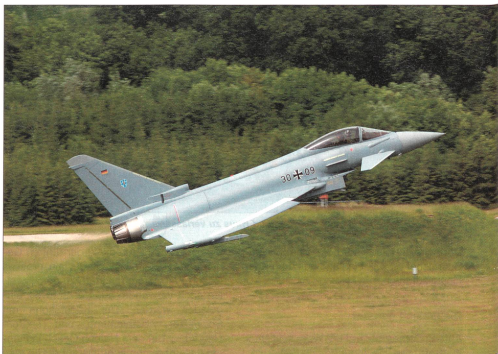
Ein einsitziger Eurofighter der deutschen Luftwaffe hebt zu einem weiteren Trainingsflug ab.

Der Anstoss zu diesem Grossprojekt wurde im Anschluss an das Tornado-Programm 1986 gegeben. Bedeutsam ist, dass zwischen den beteiligten Firmen und Luftwaffen ein unbegrenzter Wissenstrans-