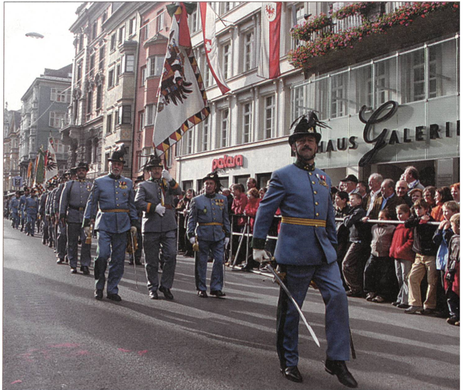
An der «Bunten Tirol-Parade» am Nationalfeiertag defilieren die Tiroler Kaiserjäger vor dem Rathaus.

halsigen, aber professionellen, 45 Minuten dauernden Rettungseinsatz die Multifunktionalität der Gebirgstruppe. Nun marschierten die 1250 Rekruten, welche erst einige Wochen im Dienst stehen, ins Tivoli-Stadion ein, gefolgt von Abordnungen der Tiroler Kaiserjäger. Einen wesentlichen Faktor bil-