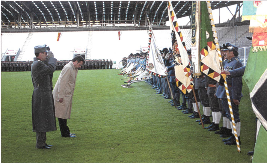
Günther Platter, der Bundesminister für Verteidigung, selbst Tiroler, erweist den angetretenen Delegationen der Tiroler Kaiserjäger und des Kaiserschützenregiments 1 die Ehre und zeigt somit seine Verbundenheit zu Tirols Tradition im Bundesheer.

tionsverbänden bis zur modernen neuen Armee bekundeten ihre Reverenz. Ein Musterbeispiel an Zusammenarbeit ohne Konkurrenzdenken, welches schon an den vergangenen Hochwasserkatastrophen im Tirol zum Tragen kam. Auf verschiedenen Plätzen in Innsbrucks Innenstadt wurde bis 16.00 Uhr eine Leistungsshow mit Vorfüh-