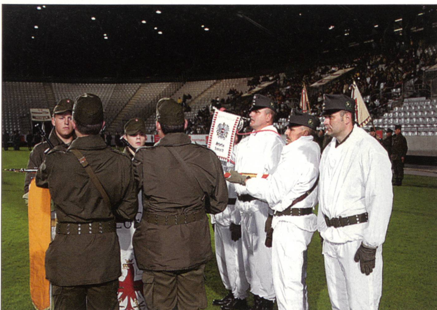
Vier der 1250 Rekruten geloben stellvertretend für ihre Kameraden die Treue zu Regiment, Fahne und Nation.

6. Jägerbrigade sind dies die Tiroler Kaiserjäger, die in einer speziellen historischen Verbindung zu den gebirgsbeweglichen Verbänden stehen. Die Kaiserjäger zeichneten sich vor allem im hochalpinen Einsatz durch herausragende Leistungen aus.