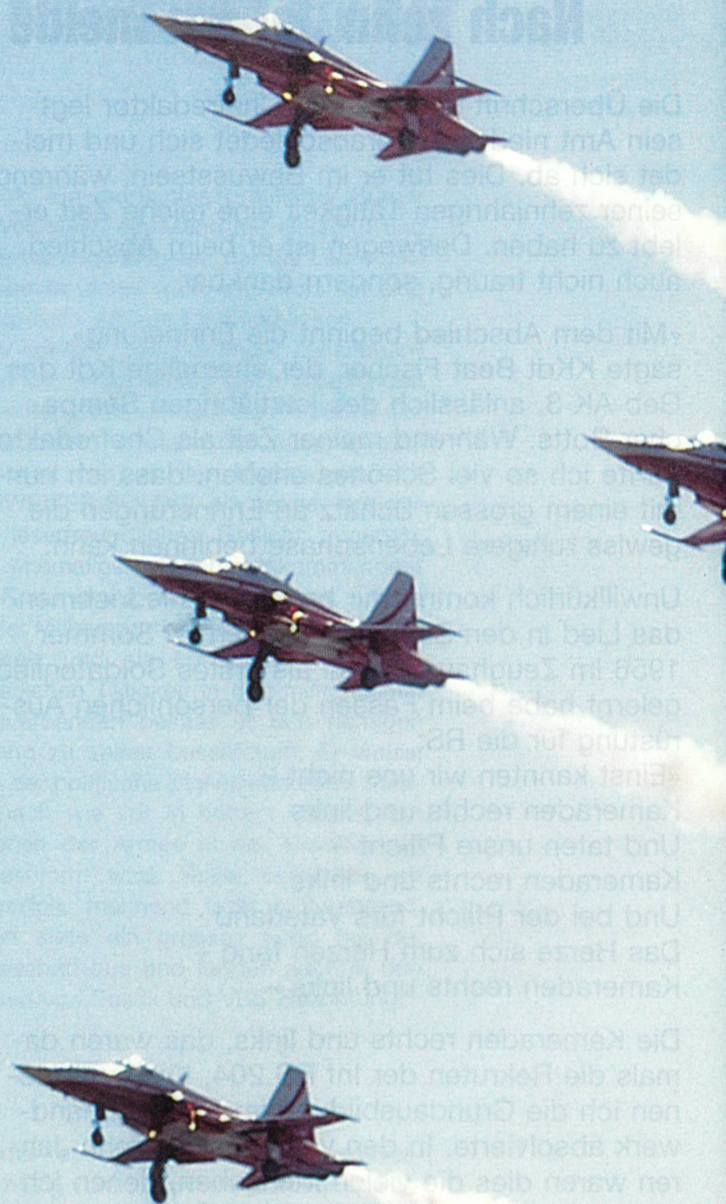
Die Vorführung der Patrouille Suisse konnten die Zuschauer hautnah und auf Augenhöhe erleben.

Punkt 14.00 Uhr wurde das Programm mit einem überraschenden und spektakulären Cougar-Auftritt eröffnet. Beim ersten Vorbeiflug des modernen Transporthelikopters liessen die Piloten 128 Flares aus dem Selbstschutzsystem Issys ausstossen und begeisterten mit dem schönen Lichtzauber das Publikum. Anschliessend wurde die Flugleistung und die Wendigkeit des Cougar-Helikopters eindrücklich demonstriert. Eine supponierte Rettungsaktion im Gebirge mit einer Alouette III, der Absprung von Fallschirmaufklärern aus einem Pilatus-Porter sowie die Feuerlöschdemonstration zweier Super-Puma-Helikopter waren die nächsten Programmpunkte.