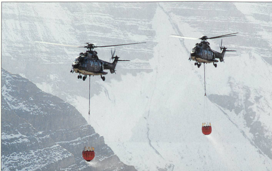
Löscheinsatz mit Super Puma.