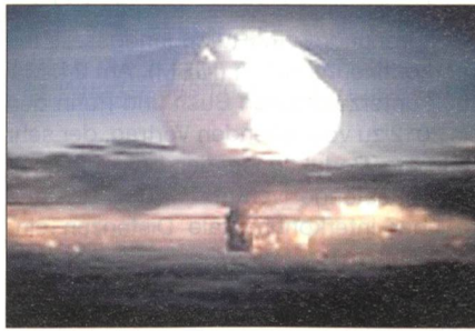
Nukleare Explosion: Auch kleinformatische Bomben könnten Hunderttausende töten.

Durchaus in Übereinstimmung mit diesem Nichteinsatz «der Bombe» während mehr als eines halben Jahrhunderts sind ausdrückliche, ernst gemeinte Drohungen gegenüber nicht nuklear gerüsteten Staaten in derselben Zeitspanne schwer nachzuweisen. Bekannt ist die mehr oder weniger offene Drohung mit dem Einsatz von Nuklearwaffen gegen London und Paris im Kontext der Suezkrise im Herbst 1956 durch die Sowjetunion, die aber eindeutig ein Bluff war, eine an die frisch gewonnene arabische Klientel gerichtete Geste. General André Beaufre, der berühmte Strategieautor, stellt in seinem Bericht «L'Expédition de Suez» (1967), und er musste es ja wissen als Oberbefehlshaber der französischen Landtruppen in der Operation, fest: «... il s'agissait d'un message où la possibilité pour les Soviétiques d'employer des armes atomiques était indiquée dans une formule indirecte». Für die Sowjets wäre das ein «Vabanque-Spiel» ohne-