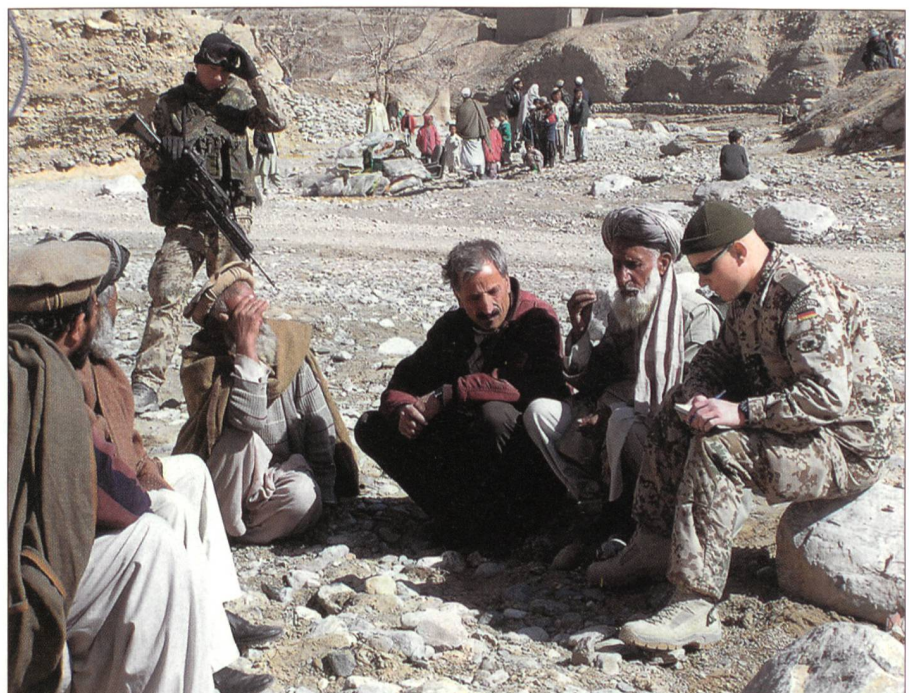
Deutsche Soldaten des PRTs in Kunduz mit der Bevölkerung.

Das Konzept der PRTs wurde ursprünglich 2002 durch die von den USA geführte Koalition eingeführt. Man wollte damit «die Herzen und Gefühle» der Bevölkerung im Kontext mit der «Operation Enduring Freedom» gewinnen. Es war eine Antwort auf