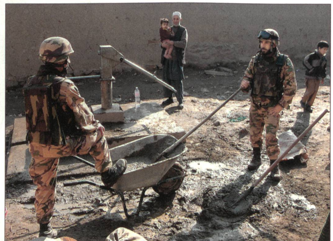
Das PRT bei der Arbeit.

Kommando West von ISAF) unter italienischer Führung errichtet. ISAF-Operationen werden um einen regionalen Mittelpunkt, bekannt als Forward Support Base (FSB-Vorgeschobene Unterstützungs-Basis) errichtet, wodurch PRTs in den Provinzen unterstützt werden. ISAF übernahm nun auch die Führung der FSB in den Aussenbezirken von Herat-Stadt, in der Provinz Herat. In dieser Basis sind unter spanischer Führung eine Schnelle Reaktions-Truppe sowie ein spanisches Spital mit Operations- und medizinischen Evakuierungsfähigkeiten enthalten. Insgesamt sind mehr als 375 militärische und zivile Personen in der FSB stationiert. Darüber hinaus hat Italien die Verantwortung über das PRT in Herat-Stadt übernommen, während Spanien ein PRT in Qal-eh Now, in der Bandisghis-Provinz, errichtet. Das PRT in Farah-Stadt, in der gleichnamigen Provinz, wird weiterhin von den USA