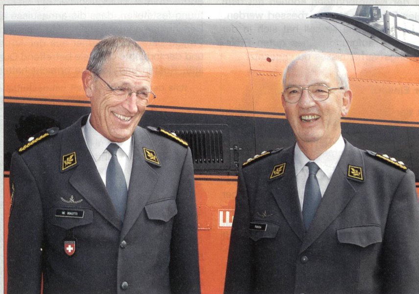
Walter Knutti löste per 1.1.2006 Hans-Ruedi Fehrlin als Kommandant der Luftwaffe ab.