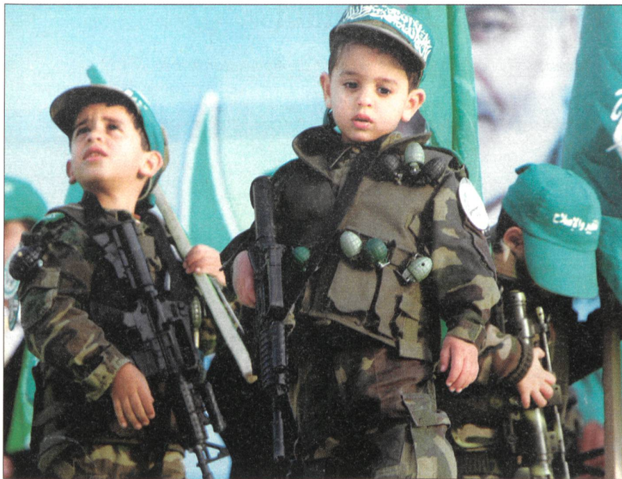
Gewaltbereiter Fundamentalismus: Kinder von Hamas-Anhängern im Gaza-Streifen.

Diejenigen Bürgerinnen und Bürger, welche die Entwicklung der Lage aufmerksam verfolgen, wissen, dass auch wir Teil dieser unsicheren und komplexen Welt sind, dass innere und äussere Sicherheit schon seit geraumer Zeit nicht mehr getrennt werden können. In der asymmetrischen Lage sind hauptsächlich die Nachrichtendienste – als erste Verteidigungslinie – zusammen mit Justiz und Polizei auf Stufe Bund, Kantone und Städte gefordert.