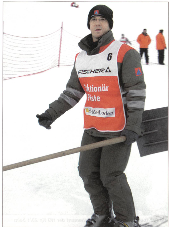
Ein Zivilschützer als Pistenfunktionär unterwegs zum Einsatz.