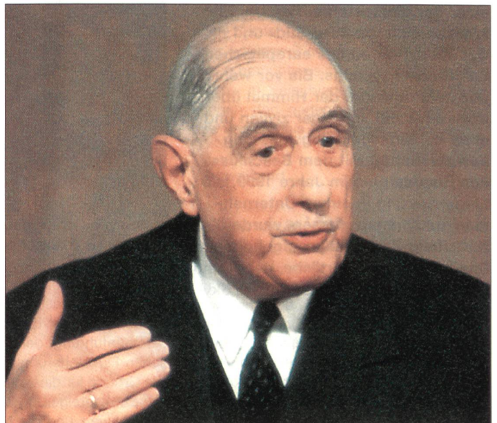
Als Chef der Résistance Vorbild für Widerstandsorganisationen: Charles de Gaulle.

Die so vorhandene operative Ausrüstung wie Waffen, Munition, Sprengstoff, Führungsrichtlinien, Chifrierunterlagen, Währung und Sanitätsmaterial sei in verschiedenen unterirdischen Depots eingelagert gewesen: «Mit Ausnahme einzelner Verantwortlicher der Führungsstäbe waren diese Orte den Mitgliedern unbekannt. Sie hatten keinen Zutritt. Die Verteilung der Güter bei den Urzellen war instruiert.» fo.