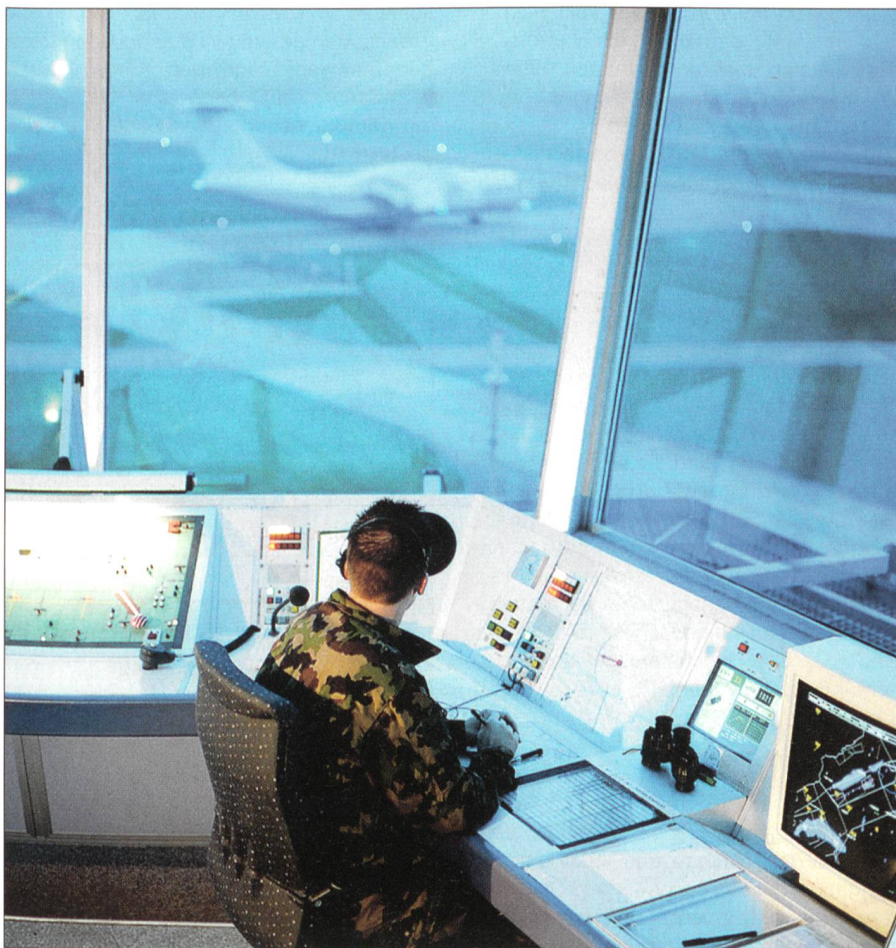
Ein militärischer Fluglotse an seinem Arbeitsplatz im Kontrollturm.