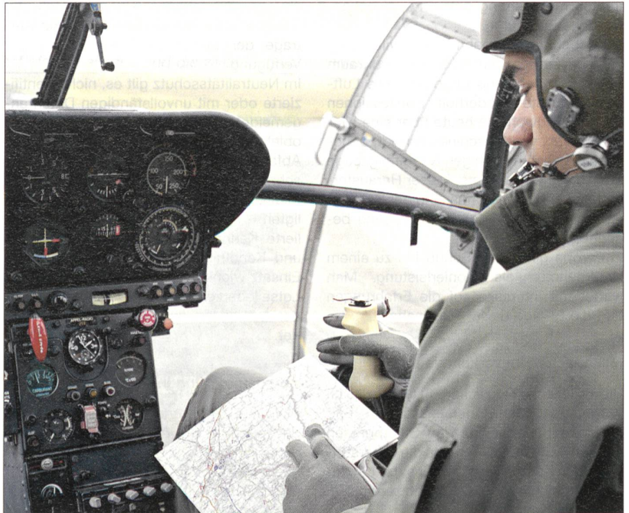
Nicht nur die Piloten der Kampfflugzeuge arbeiten eng mit den Fluglotsen zusammen, auch der Helikopterpilot wird bei der Erfüllung seiner Aufgaben unterstützt.

Der Hauptsitz befindet sich in Genf. Die Operationszentren sind in Zürich und Genf, an den Flughäfen Bern-Belp, Lugano-Agno und auf den militärischen Flugplätzen. Auf den Regionalflugplätzen St. Gallen Altenrhein, Grenchen und Les Eplatures sind die lokalen Flugsicherungsdienste an den Flugplatzbetreiber delegiert. pj.