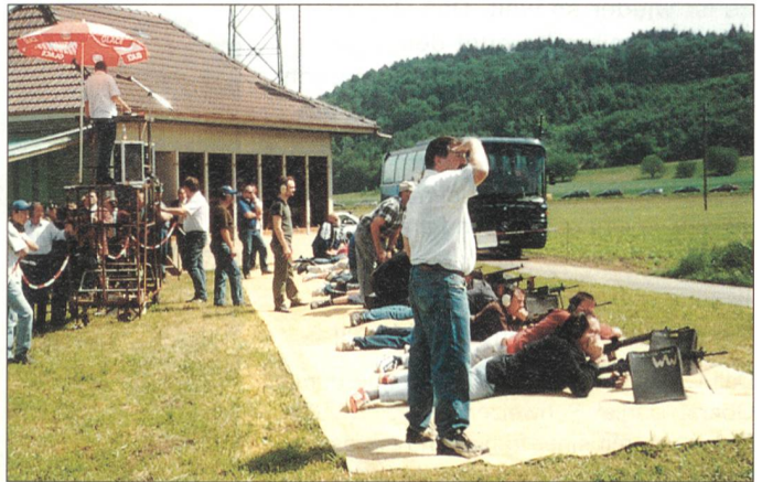
Hier wird noch ein echtes «Feldschiessen» durchgeführt: Wangenried im Kanton Bern.

Die 40. CISM-Militär-Weltmeisterschaften im Schiessen, welche vom 11. bis 17. Oktober in Thun und Bern/Riedbach stattfanden, mit 500 Schützinnen und Schützen aus 43 Nationen, 9 Weltrekorden, einer Bronzemedaille für Marcel Bürge und zwei vierten Plätzen des Gewehrschützenteams, legten auch dank einer ausgezeichneten Organisation ein gutes Zeugnis für die Schweiz ab.