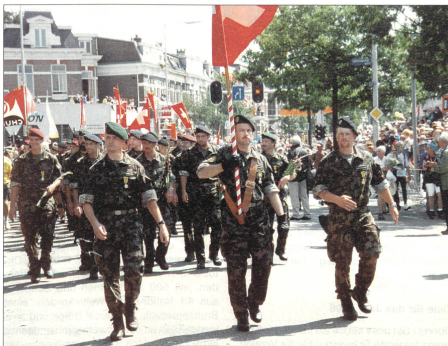
Militärgruppe in Nijmegen.

Wie immer kann man sich online anmelden, dies auf der Internetseite www.2tagemarsch.ch , wo weitere interessante Informationen abgerufen werden können. Weitere Auskünfte sind auch über die E-Mail-