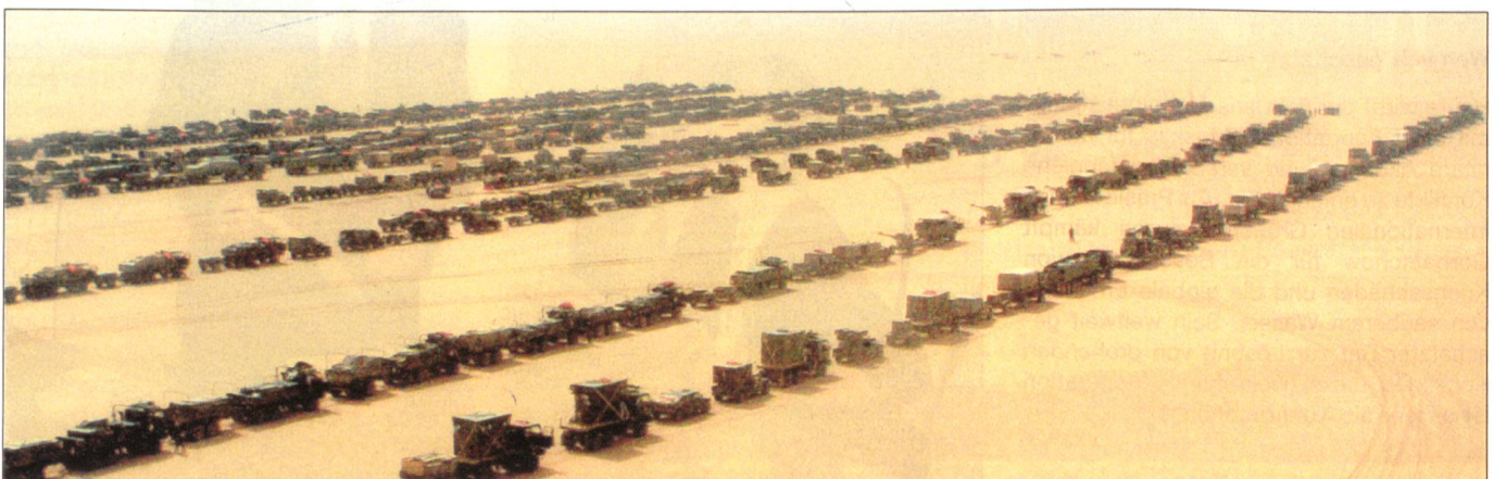
Im Wüstensand aufgestellt in Reih und Glied – vor dem Angriff auf den Irak.

Das Ende des Kalten Krieges mit der Auflösung der Sowjetunion und dem von ihr dominierten Warschauer Pakt hat die Bewertung von Chancen, Risiken und Gefahren auch für die USA dramatisch verändert. Das einstmalige klare Bedrohungsbild hat sich in ein diffuses Bild verändert. Die