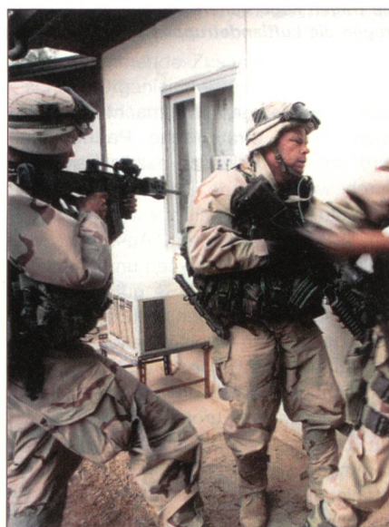
Amerikanische Infanteristen beim Häuserkampf im Irak.

Die amerikanischen Streitkräfte bekommen in der andauernden Transformation alles, was sie zur Durchführung ihrer vielfältigen Aufträge benötigen, bei denen der Kampf gegen den transnationalen Terror –