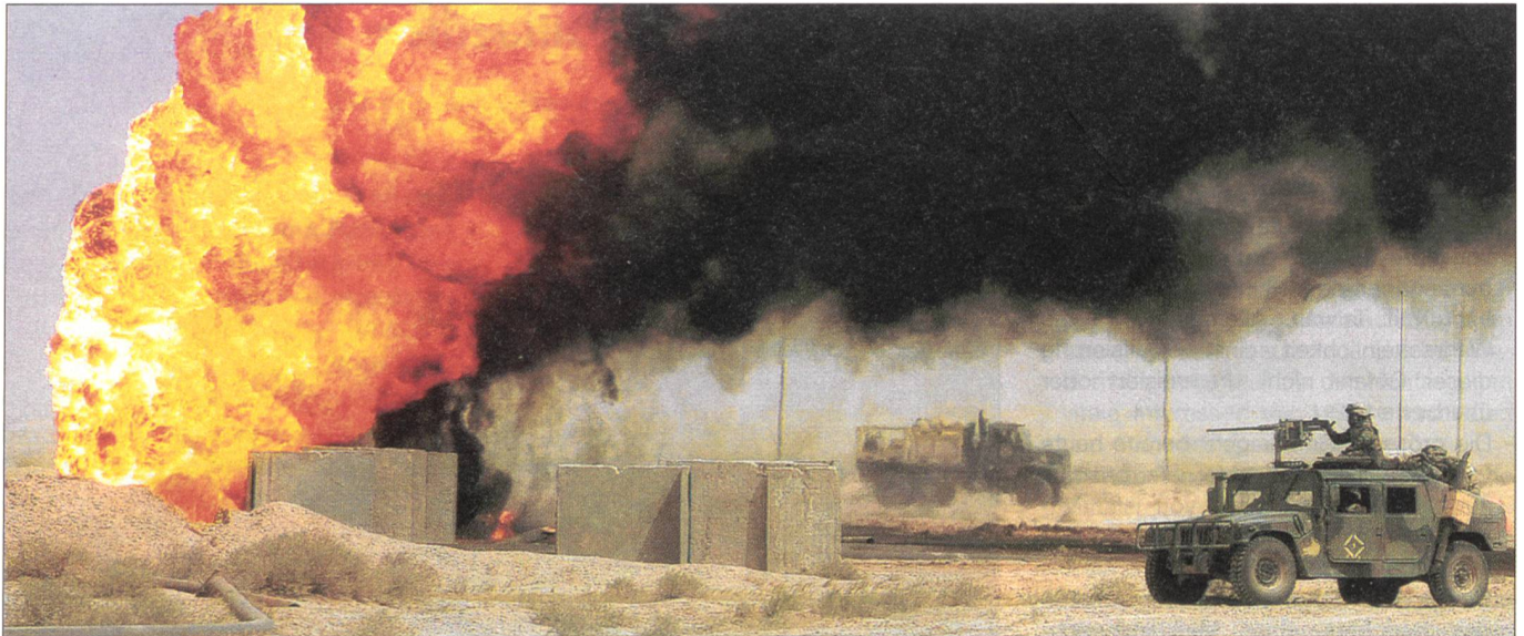
März 2003: Aufklärer der amerikanischen Marine-Infanterie stossen in die brennenden Ölfelder von Al-Rumaila vor.

«unwilligen» Partnern, die Erfahrungen aus dem Krieg gegen den transnationalen Terrorismus sowie die Erfahrungen in der Bekämpfung der Wirbelstürme Katerina und Wilma haben zu einer neuen Schwerpunktbildung und Ausrichtung in der amerikanischen Sicherheitspolitik geführt.