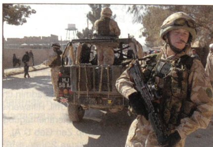
Britisches PRT in Afghanistan.

Wie bisher im Norden wird das neue PRT ein Triumvirat als Basis haben: den militärischen Kommandanten sowie Offizielle des Aussen- und Commonwealth-Amtes und des Ministeriums für Internationale Entwicklung. Rene