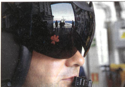
Hubschrauberpilot bei dem Experiment.

In Frankreich fand auf dem Luftwaffenstützpunkt Creil vom 27. Februar bis 17. März die Endstufe des «Multinationalen Experiments 4» statt. Das gross angelegte Experiment fand aber nicht nur in Frankreich, sondern weltweit in Simulationszentren der Streitkräfte unter NATO-Führung statt. Man testete neue Wege der gemeinsamen