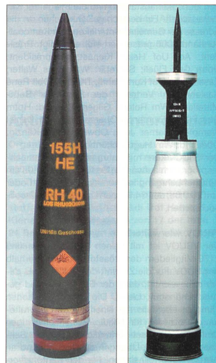
155-mm-Artilleriegeschoss für eine Reichweite von 40 km.

Im Zusammenhang mit der Abgabe von 298 Leopard 2-Kampfpanzern aus Beständen der Bundeswehr an die türkischen Streitkräfte ist Rheinmetall Defence beauftragt worden, rund 15 000 Stück Munition im Kaliber 120 mm (KE-Munition des Typs DM 63 mit zugehörigen Übungspatronen) zu liefern. Es handelt sich um so genannte Wuchtmunition auf Wolfram-Basis, die wegen ihres neuen temperaturunabhängigen Pulvers ohne Einschränkungen auch in extremen