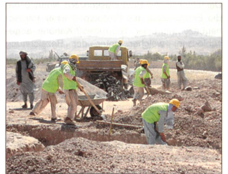
CIMIC bei der NATO in Herat (Afghanistan).

Bei einem informellen Treffen der Verteidigungsminister der EU-Staaten am 6. und 7. März in Innsbruck stimmten diese überein, ein Konzept der Einsatzkontrolle zu entwickeln, das sicherstellt, dass in allen EU-geführten Missionen eine Erweiterung der militärisch-zivilen Koordination stattfindet. Es soll ein klarer Mechanismus zur Beantwortung aller Typen von Krisen ausgeformt und bis Ende des Jahres angenommen werden. Man stimmte auch bei der Notwendigkeit überein, bei EU-Aktionen mit anderen internationalen Organisationen (UNO, NATO) bei der Beantwortung von Krisen zusammenzuarbeiten und diese Aktivitäten zu koordinieren.