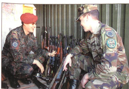
EU-Soldaten mit gesammelten Waffen.

MNTF SE wurde dabei auch durch Truppen der beiden anderen Multinationalen Task Forces, MNTF (N) and MNTF (NW) unterstützt. In Bosnien-Herzegowina sind drei Multinationale Task Forces disloziert: Nord (N), Nordwest (NW) und Südost (SE). Mehr als 150 Marines und andere Soldaten, geführt vom Kommandanten der B-Kompanie der spanischen Marines waren eingesetzt. Neben Spaniern waren Italiener und deutsche Teams beim Einsatz von Haus zu Haus eingesetzt. Sie wurden von Sprengmittelteams aus Deutschland, Finnland, Frankreich, Grossbritannien und Italien zusammen mit Sanitätsteams