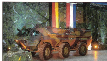
Holland erhielt ABC-Aufklärungsfahrzeuge des Typs Spürfuchs.