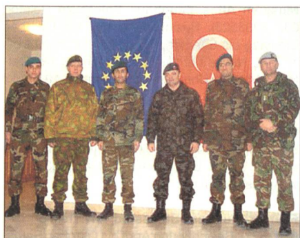
LOT der EU in Bosnien.

künften unter der lokalen Bevölkerung lebt. Insgesamt sind mehr als 40 LOT-Häuser mit ihren Teams in BiH eingesetzt.