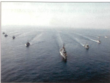
Deutscher Marineverband in Formation.

Aufbauend auf den Erfahrungen aus der Seekriegführung, insbesondere durch die Teilnahme an internationalen Übungen, diente «Good Hope» der Bestätigung des Einsatzstatus der Luftfahrzeugbesatzungen und der technischen Leistungsfähigkeit der Systeme für solche Einsätze auf See. Höhepunkt der Übung war der Abschuss von «Kormoran»-Seezielflugkörpern. Jeder der eingesetzten «Tornados» der Luftwaffe führte bis zu vier Kormorane mit und kann diese im Tiefstflug abfeuern. Der «Kormoran» ist ein 220 kg schwerer und 4,5 Meter langer Lenkflugkörper mit einem Radar-Zielsuchkopf. Er ist mit einer Reichweite von rund 30 Kilometern allwetterfähig. Mit dem «Fire and Forget»-Prinzip (nach Abschuss steuert sich der Flugkörper selbst),