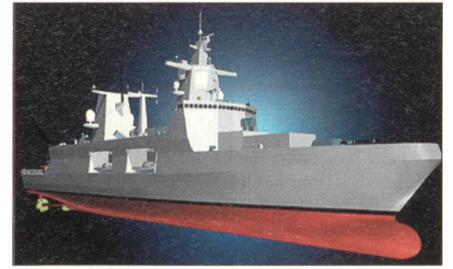
Modell der Fregatte Klasse 125.

Bei der Fregatte F125 geht es also in keiner Weise um ein Nachfolgemodell für bestehende Schiffe, sondern um die konsequente Umset-