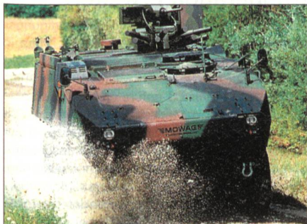
MOWAG Piranha III C APC.

Im Ganzen wurden sieben Varianten bestellt; dazu gehören ein gepanzertes Personentransporter mit einem 12,7-mm-MG, ein Schützenpanzer mit einer 30-mm-Maschinenkanone, Ambulanzfahrzeuge, Mobile Kommandoposten, Berger- und Pionierfahrzeuge sowie ein leichter Kampfpanzer, welcher mit einem CMI Defence LCTS-90-mm-Zweimannturm ausgestattet ist und bis ins Jahr 2011 die veralteten Kampfpanzer des Typs Leopard 1A5 ablösen soll.