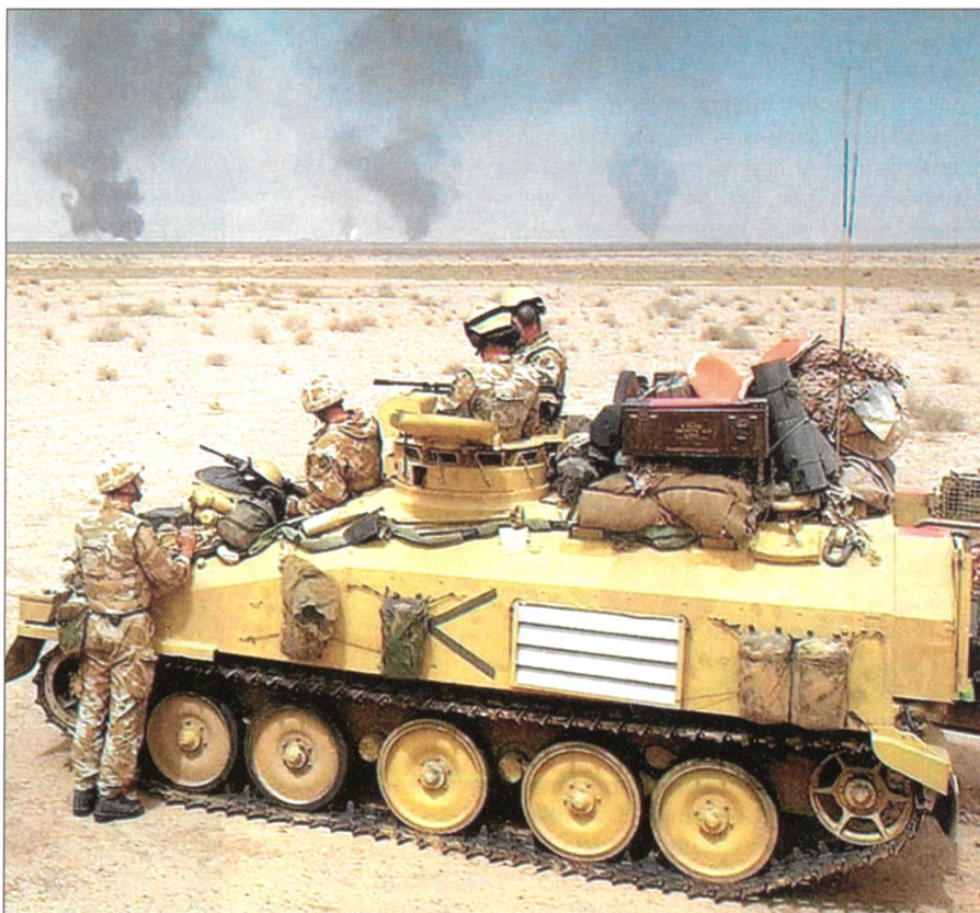
Britische Truppen vor brennenden Ölfeldern im Südirak.

PMCs wie die amerikanische Firma Blackwater, die gemäss eigenen Angaben 400 Mann im Irakkrieg beschäftigten und pro Kommandoeinheit 1000 Dollar pro Tag verrechnen, befinden sich im Zentrum des «Business of War». Blackwater wird vom