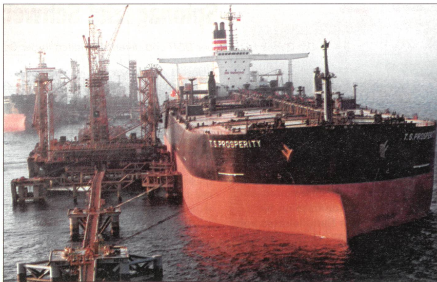
Erdöltanker in Saudi-Arabien: Gefahr für die «Tankstelle der Welt».

sinkt dann wieder auf null ab. Dann ist das Feld leer oder zumindest in einem Zustand, dass man nicht mehr rentabel fördern kann. Der Peak Oil ist also nicht das Ende des Erdölzeitalters. Sondern die Halbzeit. Der Moment, in dem das absolute Maximum an Erdöl gefördert wird. Danach gehts runter, für immer, und das Angebot kann die Nachfrage nicht mehr befriedigen. Und daher wird um den Rest immer heftiger gestritten.